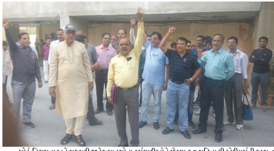
બોર્ડ-નિગમના અને સરકારી જાહેર સાહસોના કર્મચારીઓને છેલ્લા ૨૦ મહિનાથી એરીયર્સની રકમ ન ચુકવતા સચિવાલય ખાતે બપોરે ૨ થી ૨.૩૦ કલાક દરમિયાન સુનોચ્યાર કરી વિરોધ પ્રદર્શીત કર્યો હતો. આ પ્રસંગે મોટીસંખ્યામાં કર્મચારીઓ હાજર રહ્યા હતા.

ગાંધીનગર, તા. ૧ રાજ્યમાં ગ્રામસભા અભિયાન શરૂ થઈ જવા રહ્યું છે ત્યારે તેના આયોજનો અંગે વિકાસ કમિશનરશ્રીની કચેરી દ્વારા નારાજગી વ્યક્ત કરવામાં આવી છે. આ ગ્રામસભા અભિયાનના આયોજનમાં તમામ વિભાગના અધિકારી-કર્મચારી હાજર રહી શકે તે મુજબનું આયોજન જણાયું ન હોવાનું પ્રથમ દષ્ટિએ જ જણાઈ રહ્યું હોવાનું અધિક વિકાસ કમિશનરશ્રીએ જણાવ્યું હોવાનું બહાર આવવા પામેલ છે. મળતી બિનસત્તાવાર વિગતો પ્રમાણે આ ગ્રામસભા અભિયાનમાં વિલેજ ડેવલપમેન્ટ પ્લાન તેમજ મિશન અંત્યોદય હેઠળ થયેલી કામગીરી વિશેની વિવિધ વિભાગોને સાથે રાખી વાતો કરી અને તૈયાર કરવાનું સરકારે સૂચવ્યું છે પણ આયોજનમાં આ બાબતે ઘણું બધું ખૂટતું જણાયું છે. એક એવી પણ વાત આ બિનસત્તાવાર સૂત્રોમાંથી જાણવા મળેલ છે કે બંધારણ શિડ્યુલ ૧૧ મુજબ નિયત થયેલ ૨૯ જેટલા વિષયો સૂચવવામાં આવ્યા છે અને દરેક વિભાગના અધિકારીઓ સાથે સુયોગ્ય સંકલન રાખી આયોજન કરવા માટેની સૂચનાનું સરેઆમ ઉલ્લંઘન થયું છે. વિકાસ કમિશનરશ્રીની કચેરી દ્વારા તો આખેઆખું આયોજન નવેસરથી તૈયાર કરી મોકલી આપવા જણાવવામાં આવ્યું હોવાની વાતો પણ પંચાયત વિભાગના સૂત્રોમાંથી જાણવા મળી છે. ગ્રામસભા અભિયાન ૩૧મી ડિસેમ્બર સુધી ચલાવવાનું છે અને દરેક તાલુકામાં રોજની બે જ ગ્રામસભાઓ યોજવાની સ્પષ્ટ સૂચનાઓ પછી પણ તંત્ર દ્વારા જે અવગણના કરવામાં આવી છે તેની ગંભીર નોંધ સરકાર સુધી પડવા પામી હોવાનું સચિવાલયના સૂત્રોમાંથી જાણવા મળેલ છે.