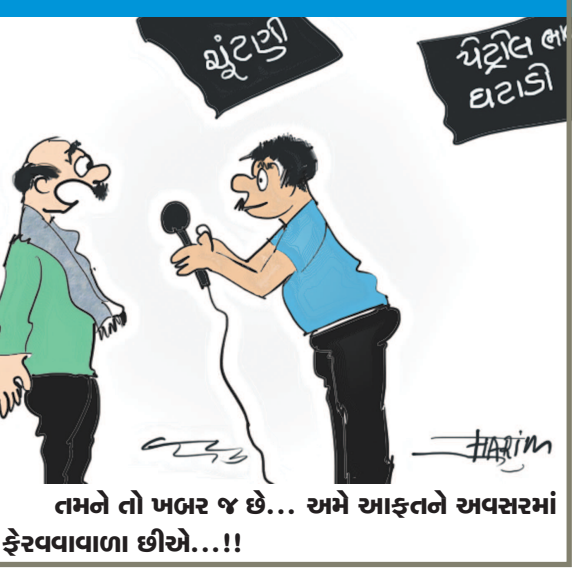
તમને તો ખબર જ છે... અમે આફતને અવસરમાં ફેરવવાવાળા છીએ...!!