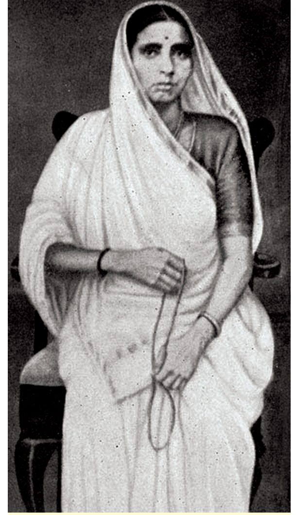
પૂતળીબાઈ એટલે સંસ્કારની મિસાલ. માણસ કોઈપણ પરિસ્થિતિમાં હોય, તે ચાહે તો પોતાના સંસ્કારોને જાળવી શકે છે. પરિસ્થિતિ અનુસાર ઢબી જઈને પોતાની જાતને કે વ્યક્તિત્વને બદલી નાખવાની જરૂરિયાત હોતી નથી. માણસ નબળો પડે ત્યારે એવું અનુભવે છે. ગાંધીજી દેશ છોડીને પરદેશ જતા હતા ત્યારે માતા પૂતળીબાઈએ એમને પરસ્પરીગમન ન કરવાની, માંસ-મદિરા ન ખાવાની પ્રતિજ્ઞા લેવડાવી હતી, જે ગાંધીજીએ આજીવન પાળી. આંતરિક હિંમત હોય તો પરિસ્થિતિ તમને ડગાવી ન શકે એ ગાંધીજી માતા પાસેથી શીખ્યા.

સેવિકા રંભા આપણે જાણીએ છીએ કે ગાંધીજીને અંધારામાં એકલા જતાં ડર લાગતો હતો અને રંભાએ એમને શીખવ્યું હતું કે 'રામનામ જપતાં અંધારામાં જશો તો ડર નહીં લાગે.' ગાંધીજીએ એવું ક્યું ને અંધારાનો ડર દૂર થયો. એટલું જ નહીં, એમને રામનામ પર આસ્થા થઈ જે આજીવન ટકી, બીજા શબ્દોમાં આ વાતને સમજાવે તો રંભાએ એમને શીખવ્યું કે હિંમત માણસની અંદર જ હોય છે. માણસે ભય જાત પર ભરોસો કરીને આગળ વધવાનું હોય છે. આજીવન ગાંધીજીએ પોતાની જાતમાંથી જ હિંમત મેળવી ને આગળ વધતા રહ્યા.