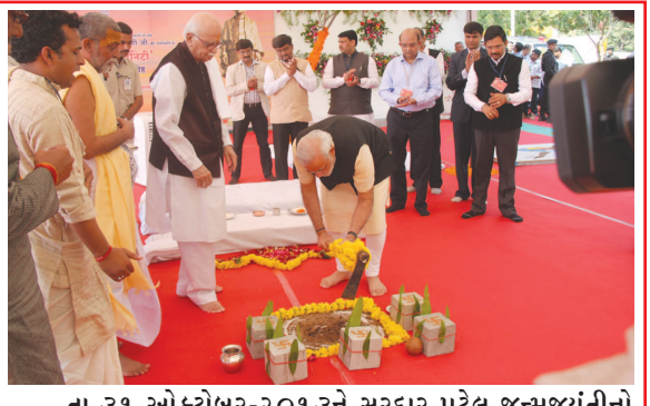
તા.૩૧ ઓક્ટોબર-૨૦૧૮ને સરદાર પટેલ જન્મજયંતીનો દિવસ... તત્કાલિન મુખ્યમંત્રી નરેન્દ્રભાઈ મોદીએ પોતાના દ્રઢ સંકલ્પને સાકાર કરવાના મક્કમ ઈરાદાને મૂર્તિમંત કરવા સ્ટેચ્યુ ઓફ યુનિટીનું ખાતમુહૂર્ત કર્યું.

સ્ટેચ્યુ ઓફ યુનિટીના નિર્માણ માટે ગુજરાતની જીવાદોરી અને પૂણ્યસલિલા માનવ દાન સાનિધ્યથી વિશેષ કોઈ સ્થળ ન હોઈ શકે તે ન્યાયે સરદાર સરોવરની સામેની સાધુ બેટની વિશાળ જગ્યા પસંદ કરવામાં આવી.