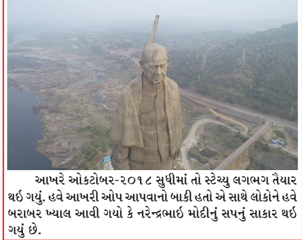
આખરે ઓક્ટોબર-૨૦૧૮ સુધીમાં તો સ્ટેચ્યુ લગભગ તૈયાર થઈ ગયું. હવે આખરી ઓપ આપવાનો બાકી હતો એ સાથે લોકોને હવે બરાબર ખ્યાલ આવી ગયો કે નરેન્દ્રભાઈ મોદીનું સપનું સાકાર થઈ ગયું છે.