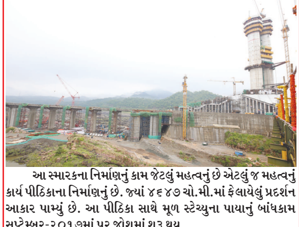
આ સ્મારકના નિર્માણનું કામ જેટલું મહત્વનું છે એટલું જ મહત્વનું કાર્ય પીઠિકાના નિર્માણનું છે. જ્યાં ૪૬૪૭ ચો.મી.માં ફેલાયેલું પ્રદર્શન આકાર પામ્યું છે. આ પીઠિકા સાથે મૂળ સ્ટેચ્યુના પાયાનું બાંધકામ સપ્ટેમ્બર-૨૦૧૭માં પૂર જોશમાં શરૂ થયું.