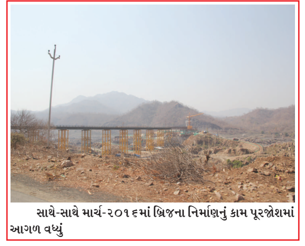
સાથે-સાથે માર્ચ-૨૦૧૬માં બ્રિજના નિર્માણનું કામ પૂરજોશમાં આગળ વધ્યું