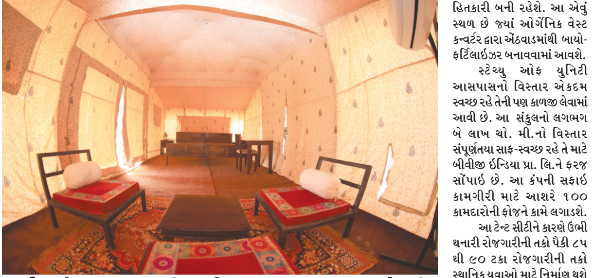
નર્મદા મૈયાના કુદરતી સાનિધ્યમાં ૭૦ હજાર ચો.મી. વિસ્તારમાં ૨૫૦ ટેન્ટનું વિશાળ નગર નિર્માણ કરાયું