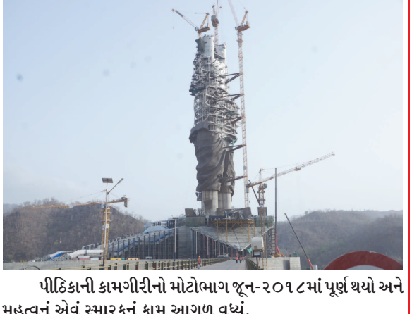
પીઠિકાની કામગીરીનો મોટોભાગ જૂન-૨૦૧૮માં પૂર્ણ થયો અને મહત્વનું એવું સ્મારકનું કામ આગળ વધ્યું.