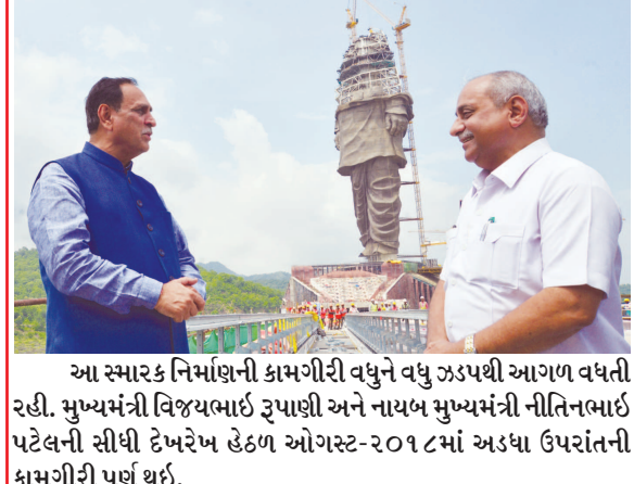
આ સ્મારક નિર્માણની કામગીરી વધુને વધુ ઝડપથી આગળ વધતી રહી. મુખ્યમંત્રી વિજયભાઈ રૂપાણી અને નાયબ મુખ્યમંત્રી નીતિનભાઈ પટેલની સીધી દેખરેખ હેઠળ ઓગસ્ટ-૨૦૧૮માં અડધા ઉપરાંતની કામગીરી પૂર્ણ થઈ.