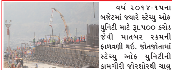
વર્ષ ૨૦૧૪-૧૫ના બજેટમાં જ્યારે સ્ટેચ્યુ ઓફ યુનિટી માટે રૂ.૫૦૦ કરોડ જેવી માતબર રકમની ફાળવણી થઈ. જોતજોતામાં સ્ટેચ્યુ ઓફ યુનિટીની કામગીરી જોરશોરથી ચાલુ થઈ. ગુજરાતના તત્કાલિન મુખ્યમંત્રી શ્રીમતી આનંદીબહેન પટેલે તા.૨૭ ઓક્ટોબર-૨૦૧૪ના રોજ સ્ટેચ્યુના નિર્માણ કાર્યનો પ્રારંભ કરવાનો વર્ક ઓર્ડર એલ એન્ડ ટી કંપનીને આપ્યો અને શરૂ થઈ યુદ્ધના ધોરણે સ્ટેચ્યુના નિર્માણની કામગીરી. આ કામગીરી દરમિયાન સમગ્ર સંકુલની આનુષંગિક કામગીરીનો પણ પ્રારંભ થયો. ૧૫મી ડિસેમ્બર-૨૦૧૪ના રોજ રાફ્ટ કોન્ક્રીટની કામગીરીનો પ્રારંભ થયો. ડિસેમ્બર-૨૦૧૫ સુધીમાં પાયાનું મહત્વનું કામ આગળ વધ્યું.