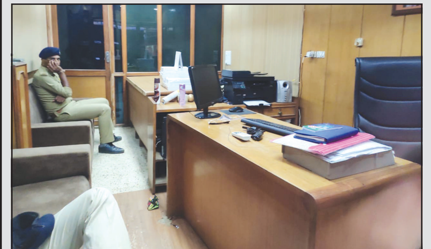
ગાંધીનગર, તા. ૧૦ ગાંધીનગર શહેરના સેક્ટર-૨૧માં ભર બપોરે ગોળીબારની ઘટના બનતા હોહા મચી ગઈ હતી. સેક્ટર-૨૧ વિશ્વકર્મા શોપીંગ સેન્ટરમાં આવેલી ઓફીસમાં ગોળીબારની ઘટનામાં એક યુવકને ગંભીર ઈજા પહોંચતા તાત્કાલીક ખાનગી હોસ્પિટલમાં સારવાર માટે ખસેડવામાં આવ્યો છે. મિત્રને પોતાની રિવોલ્વર ખાતાવતા સમયે લોક કરવા જતા અકસ્માતે ટ્રીગર દબાઈ જતા સામે બેઠેલા

સેક્ટર-૨૧ વિશ્વકર્મા શોપીંગ સેન્ટર સ્થિત ઓફીસમાં અકસ્માતે ટ્રીગર દબાઈ જતા ગોળીબારથી સામે બેઠલ મિત્રને ગંભીર ઈજા