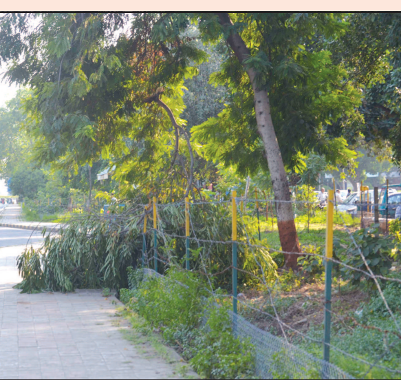
વરસાદના છેલ્લા રાઉન્ડ દરમ્યાન શહેરમાં જોરદાર વાવાઝોડુ ફુંકાયું હતું. આ વાવાઝોડાના કારણે શહેરમાં સંખ્યાબંધ વૃક્ષો ધરાશયી થઈ ગયા હતા. હજુ પણ ઠેર ઠેર ઘણા વૃક્ષોની ડાળીઓ જોખમરૂપ લટકી રહી છે.