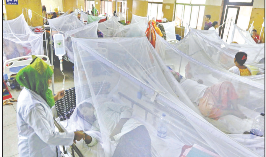
પ્રતિદિન શહેરમાં ડેન્જુનો કહેર વધી રહ્યો છે. શહેરની ખાનગી દવાખાના મોટીસંખ્યામાં ડેન્જુના કેસ વધુ માત્રામાં ડર્દીઓની લાંબી કતારો જોવા મળી રહી છે. ત્યારે ગાંધીનગર સિવિલની ઓપીડીમાં પણ દર્દીઓની લાંબી લાઈનો લાગે છે.

ગાંધીનગર, તા. ૧૦ ગાંધીનગર શહેર અને આસપાસના વિસ્તારમાં ડેન્જુએ અજગરી ભરડો લીધો છે. દિન