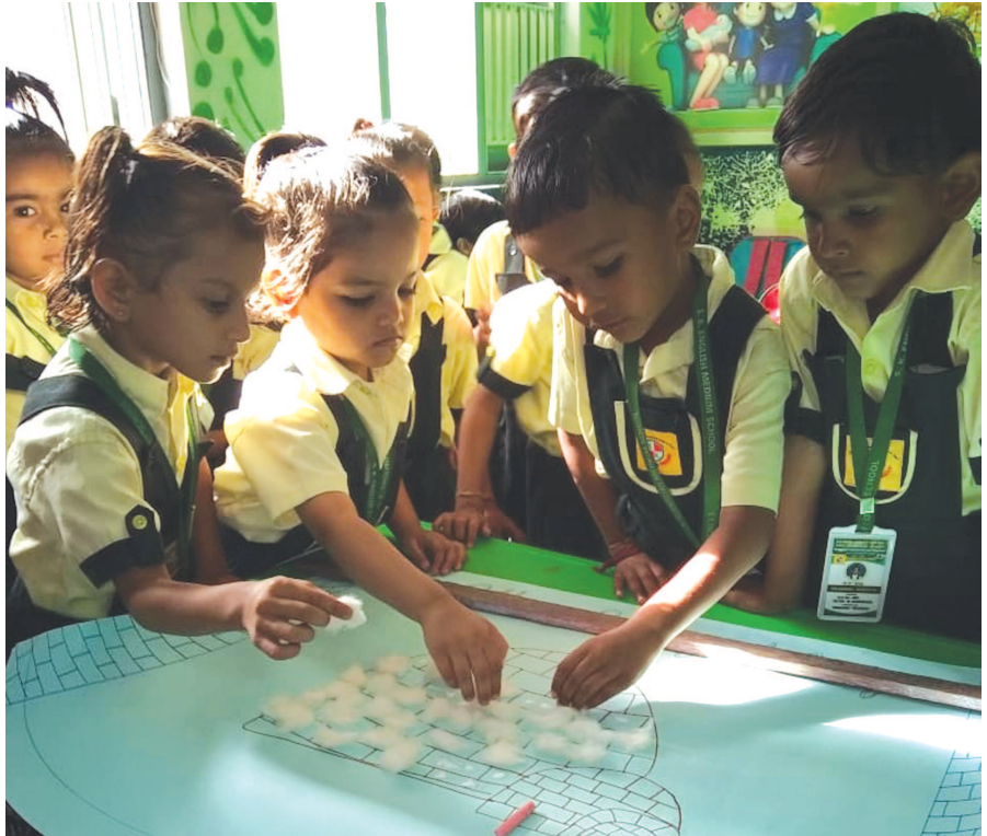
સર્વ વિદ્યાલય કેળવણી મંડળ દ્વારા સંચાલિત એસ. કે. પટેલ સ્કૂલમાં 'કોટન પેસ્ટિંગ' એક્ટિવિટી આયોજિત કરવામાં આવી હતી...