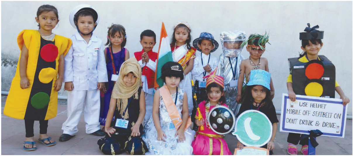
ગાંધીનગર, તા. ૧૨ સર્વ વિદ્યાલય કેળવણી મંડળ સંચાલિત એસ. વી. ઈંગ્લિશ મીડિયમ પ્રિ-સ્કૂલમાં 'ફેન્સી ડ્રેસ કોમ્પિટિશન' યોજાઈ ગઈ...