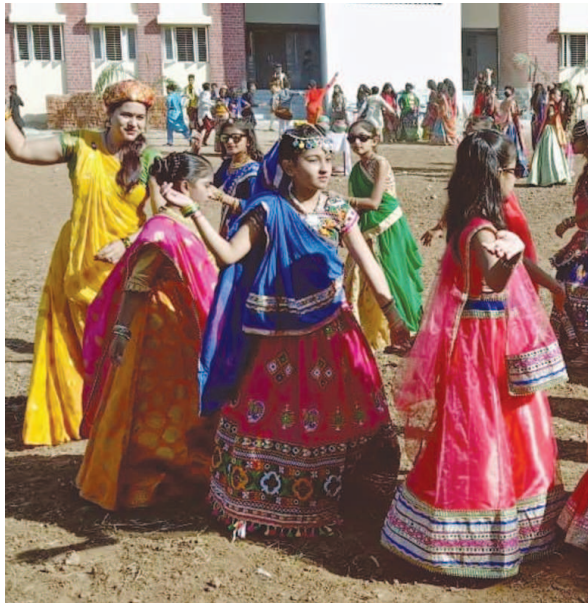
ગરબા સૌ કોઈ ગુજરાતીઓને પ્રિય હોય છે. ગરબાનું નામ સાંભળતાંની સાથે જ ગુજરાતીઓના પગ થનગનવા લાગતા હોય છે...