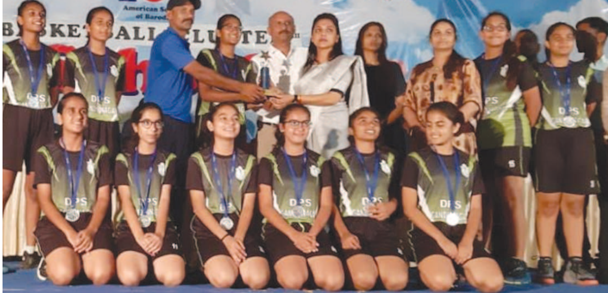
વડોદરા ખાતે અમેરિકન સ્કૂલ ઓફ બરોડા સીબીએસટી વેસ્ટ ઝોન ક્લસ્ટરની બાસ્કેટ બોલ ટુર્નામેન્ટનું આયોજન કરવામાં આવ્યું હતું...