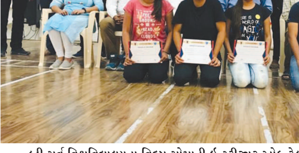
કડી સર્વ વિશ્વવિદ્યાલયના વિદ્યુષ સોમાની ઈન્સ્ટીટ્યુટ ઓફ ટેકનોલોજી એન્ડ રીસર્ચ કડી ખાતે એક દિવસીય સ્પોર્ટ્સ ડેનું આયોજન કરવામાં આવેલ હતું. આ સ્પોર્ટ્સ ડેનું આયોજન શિક્ષણની સાથે સાથે વિદ્યાર્થીઓનો સર્વાંગી વિકાસ થાય તથા તેઓ માનસિક સાથે શારીરિક રીતે પણ મજબૂત અને સ્વસ્થ રહે તે ઉદ્દેશથી આયોજન કરવામાં આવ્યું હતું. આ સ્પોર્ટ્સ ડેમાં વિદ્યાર્થીઓએ વિવિધ રમતોમાં ભાગ લીધો હતો. દિવસના અંતે પ્રિન્સિપાલ દ્વારા વિજેતાઓને પ્રમાણપત્ર આપીને પ્રોત્સાહિત કરવામાં આવ્યા હતા.