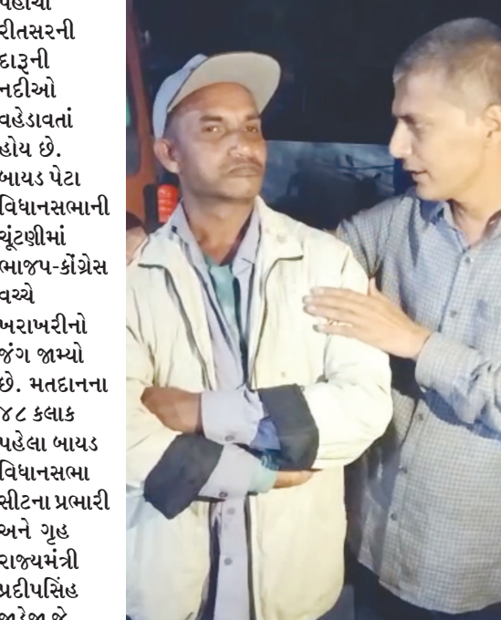
પોલીસ તંત્ર ઊંધા માથે પછડાયું હતું. શનિવારે રાત્રે રેમાઈ જિલ્લા પંચાયત સીટના કીર્તિ

જનતા રેડ કરી પીકઅપ ડાલામાંથી ૨.૩ લાખ રૂપિયાનો વિદેશી દારૂ ઝડપી પાડતા અને જનતા રેડના પટેલે અને પ્રજાજનોએ બાયડની વૃંદાવન હોટલ આગળ બે પીકઅપ ડાલામાં વિદેશી દારૂ ભરેલ પકડી પાડ્યા હતા. પીકઅપ ડાલાના ડ્રાઈવરે લોકો સમક્ષ નિવેદન આપ્યું હતું કે, ઈસરી પોલીસ સ્ટેશનના પીએસઆઈ તબિયાડ અને રાઈટરે પીકઅપ ડાલામાં માલસામાન ભરી આપ્યો હોવાનું અને દારૂ ભરેલ હોવાથી અજાણ હોવાનો ડોળ કરતા લોકોએ પીકઅપ ડાહુ તેના હાથે ખોલાવી અંદર વિદેશી દારૂ ભરેલી પેટીઓ બતાવી હતી જે અંગેનો સોશયલ મીડિયામાં વાઈરલ થતા રાજકારણમાં ભારે ગરમાવો આવી ગયો છે.