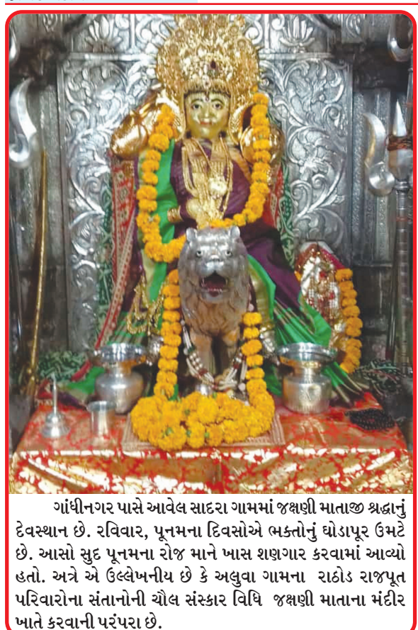
ગાંધીનગર પાસે આવેલ સાદરા ગામમાં જશ્વણી માતાજી શ્રદ્ધાનું દેવસ્થાન છે.

આ વેબીનારમાં આદિવાસી સમુદાયો, રાજકારણ અને ઓળખને સમજાવવા માટે ગાંધી અને ગાંધીવાદના વારસોને સમજાવવાનો પ્રયાસ કરવામાં આવ્યો હતો. આઝાદી પછીની ગાંધીવાદી યજ્ઞવળનો ઈતિહાસ, આદિવાસી હક માટેના સમકાલીન સંઘર્ષો, આદિવાસીઓના સંબંધમાં ગાંધીજીનો વારસો, અને તેમના વિચારોને હાલના આદિવાસી પર કેવી અસર પડી છે તેની ચર્ચા કરવા માટે ઘણા ગાંધીવાદી નિષ્ણાતો, વિદ્વાનો અને આદિવાસી કાર્યકરોએ આ વેબીનારમાં ભાગ લીધો હતો.