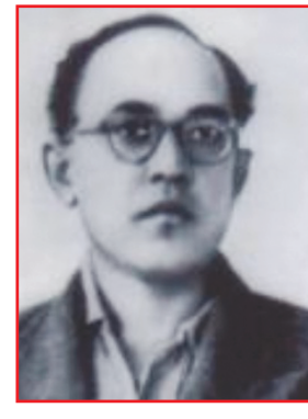
ઉપરાંત સ્થળો શોધ્યા હતા. આજ સુધી ગુજરાતમાં પ્રાચીન સંસ્કૃતિના સૌથી વધુ સ્થળો