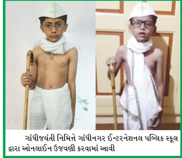
ગાંધીજયંતિ નિમિત્તે ગાંધીનગર ઈન્ટરનેશનલ પબ્લિક સ્કૂલ દ્વારા ઓનલાઈન ઉજવણી કરવામાં આવી