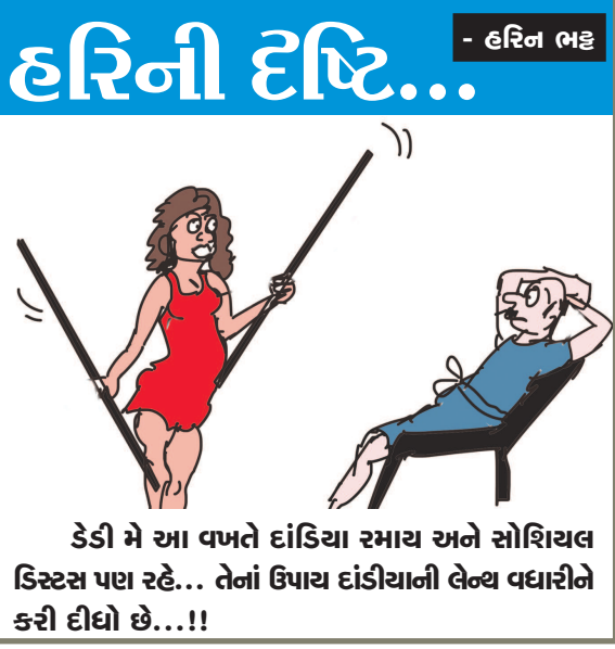
કેડી મે આ વખતે દાંડિયા રમાય અને સોશિયલ ડિસ્ટન્સ પણ રહે... તેનાં ઉપાય દાંડિયાની લેખ્ય વધારીને કરી દીધો છે...!!