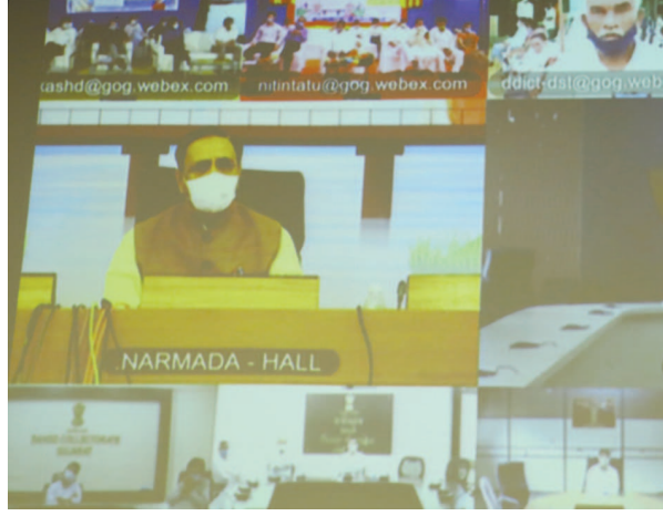
ઉ. વિજય રૂપાણીએ આ નવિન વ્યવસ્થા ટેકનોલોજીના મહત્તમ ઉપયોગ સાથે વહિવટી તંત્રના વર્કક્લેરમાં બદલાવ લાવશે. એટલું જ નહિ, કચેરીઓમાં અરજદારોની થતી ભીડભાડ પણ અટકાવશે એવો વિશ્વાસ વ્યક્ત

નેમ વ્યક્ત કરી છે. મુખ્યમંત્રીએ રાજ્ય સરકારના સાયન્સ ટેકનોલોજી વિભાગે ભારત નેટ ફેઈઝ-૨ સાથે જોડાણ દ્વારા પ્રથમ તબક્કે રાજ્યની ૩ હજારથી વધુ ગ્રામ પંચાયતોમાં લોકોને ૨૭ જેટલી વિવિધ સરકારી સેવાઓ યોજનાઓ ઘર આંગણે બેઠા પહોંચાડવાના ઐતિહાસિક કદમ ડિજિટલ સેવા સેતુનો ગાંધીનગરથી પ્રારંભ કરાવ્યો હતો. નાયબ મુખ્યમંત્રી નીતિન પટેલ મહેસાણા જિલ્લાથી તેમજ અન્ય મંત્રીશ્રીઓ સંબંધિત જિલ્લાઓમાંથી વિડીયો કોન્ફરન્સ દ્વારા આ ડિજિટલ સેવા સેતુના શુભારંભમાં જોડાયા હતા. મુખ્યમંત્રીએ સ્પષ્ટપણે કહ્યું કે, ગામડાના સામાન્ય માનવી, ગરીબ વ્યક્તિને પ્રમાણપત્રો, દાખલા કે યોજનાઓ માટે જરૂરી દસ્તાવેજો મેળવવા તાલુકા-જિલ્લા મથકે જવું જ ન પડે તેના સમય અને નાણાં બેંચનો બચાવ