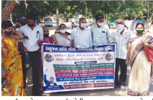
ઉત્તરપ્રદેશના હાથરસમાં બનેલી ઘટનાના પ્રત્યાઘાત સમગ્ર દેશમાં પડ્યા છે. ગાંધીનગરમાં પણ તેનો વિરોધ થઈ રહ્યો છે. સત્યાગ્રહ છાવણી ખાતે બહુજન ક્રાંતિ મોરચા દ્વારા હાથરસ મુદ્દે દેખાવો અને પ્રદર્શન યોજવામાં આવ્યું હતું. બહુજન ક્રાંતિ મોરચાના સભ્યો મોટી સંખ્યામાં આ ધરણાં પ્રદર્શનમાં જોડાયા હતા.

કોરોનાની વૈશ્વિક મહામારી ચાલી રહી છે. સામાન્ય નાગરિક કોરોના સામે ઝડપી રહ્યા છે. દરેક વ્યક્તિ કોરોનાથી કેવી રીતે બચવું તેને લઈ ચિંતિત નજરે પડે છે. તેવા સમયે શહેરમાં કોઈ પણ વ્યક્તિએ એકઠા થઈ આંદોલન ન કરવું તેમ અને કવાર જીપીએસસી, એલઆરડી અને એસઆરપી ઉમેદવારોને કહેવામાં આવ્યું છે. શહેરમાં અગાઉ બે ત્રણ વાર ઉમેદવારોને રીટેઈન કરીને મુક્ત કરી દેવામાં આવ્યા હતા. તેમ છતાં એસઆરપી, એલઆરડી, અને જીપીએસસીના ઉમેદવારો માનતા ન હતા અને અન્ય વ્યક્તિઓ કોરોના થી સંક્રમિત થાય તે રીતે આંદોલન કરવા વારંવાર બેસી જતા હતા. ઉમેદવારો પોતાના ભવિષ્યનો વિચાર કર્યા વિના કોઈપણ તંત્રની મંજૂરી વિના રાજ્યભરમાંથી આવેલા ઉમેદવારો બેસી જતા હતા. જેથી નાગરિકોને કોરોનાથી સંક્રમિત થતા અટકાવવા માટે પોલીસ ઉમેદવારોને અટકાવવા જરૂરી બન્યા હતા. જેથી છેલ્લા બે દિવસમાં ત્રણ ગુનાઓ નોંધી ૧૯૧ ઉમેદવારો સામે ગુનો નોંધી કાયદેસરની કાર્યવાહી કરવામાં આવી છે. જ્યારે પોલીસ ઉમેદવારોને કોઈની ચકામણી કે સોશયલ મીડિયાના માધ્યમથી ખોટી વાતોમાં આવી જઈને ગાંધીનગર આવી ન જવું જોઈએ. કોરોનામાં પોતાનું અને પરિવારનું ધ્યાન રાખવું. પોતાની કાળજી રાખવી અને આપણાથી બીજા નાગરિકો સંક્રમિત ન થાય તેનું પણ ધ્યાન રાખવું તેવી અપીલ પોલીસ તંત્ર દ્વારા કરવામાં આવી છે.