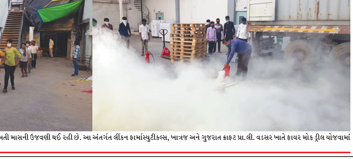
ઓદ્યોગિક સલામતી અને સ્વાસ્થ્યની કચેરી, ગાંધીનગર દ્વારા સલામતી માસની ઉજવણી થઈ રહી છે. આ અંતર્ગત લીકન ફાર્માસ્યુટીકલ્સ, ખાત્રજ અને ગુજરાત કાફેટ પ્રા. લી. વડસર ખાતે ફાયર મોક ડ્રીલ યોજવામાં આવી હતી.

મનાય છે. પરંતુ ઓછા મેનપાવર સાથે કામ કરતી આર ટી ઓ કચેરીમાં વારંવાર થતી ટેકનિકલ ખામીના લીધે અરજદારો ના કામો પણ અટવાય છે. આર ટી ઓ કચેરી આમ પણ લાંબા સમયથી દુર્વિધાઓથી ઘેરાયેલી છે. પયામ પાર્કીંગ વ્યવસ્થાના અભાવે આર ટી ઓ કચેરી બહાર મુખ્ય ધ માર્ગ પર વાહનોનો બડકલો થાય છે. જેના લીધે ગ માર્ગ પર માગ સલામતી પણ જોખમીય છે. ત્યારે આ વિસ્તારમાં યોગ્ય ટ્રાફિક નિયમન થાય તે પણ અનિવાર્ય છે. સ્થાનિક રહીશોમાં પણ આ વિસ્તારમાં વધતા દબાણો દુર કરવા માટે અને માગ સલામતી જળવાય તે માટે જરૂરી પગલા લેવાની માંગ ઉઠવા માટે છે.