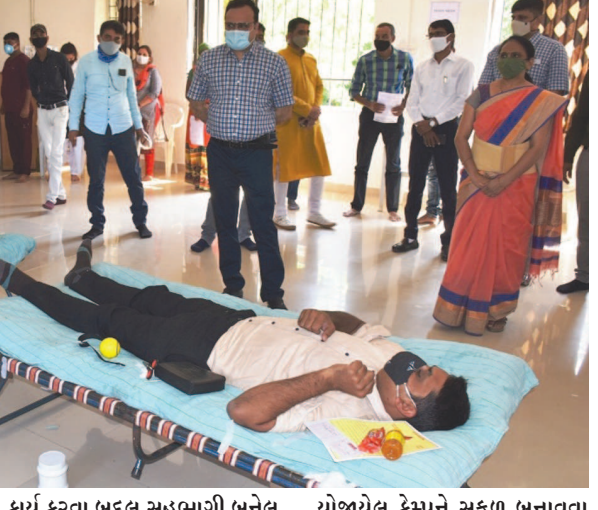
કેમ્પના આયોજકો અને રક્તદાતાઓને સમાજમાં દ્રષ્ટાંતરૂપ ઉમદા કાર્ય કરવા બદલ અભિનંદન પાઠવ્યા હતા. ગાંધીનગર ખાતે