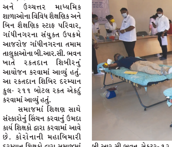
જિલ્લાના તમામ તાલુકામાં આ રક્તદાન કેમ્પનું આયોજન કરવામાં આવ્યું હતું. ગાંધીનગર ખાતે

અને રક્તદાતાઓ સાથે વાતચીત વિડિયો કોન્ફરન્સના માધ્યમથી કરી હતી. સમાજને શિક્ષણ આપવા સાથે સાથે સમાજ સેવાના આ ઉમદા કેમ્પના આયોજકો અને રક્તદાતાઓને સમાજમાં દ્રષ્ટાંતરૂપ ઉમદા કાર્ય કરવા બદલ અભિનંદન પાઠવ્યા હતા. ગાંધીનગર ખાતે