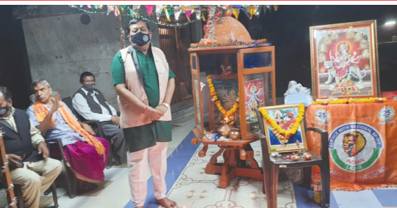
કોરોના વાયરસ ભગવાં નવરાત્રિ ઉત્સવ ઈન્ડિયન લાયન્સ ગાંધીનગર સ્વર્ણમ કલબ દ્વારા ઉજવાયો