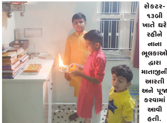
સેક્ટર-૧૩બી ખાતે ઘરે રહીને નાના ભૂલકાઓ દ્વારા માતાજીની આરતી અને પૂજા કરવામાં આવી હતી.