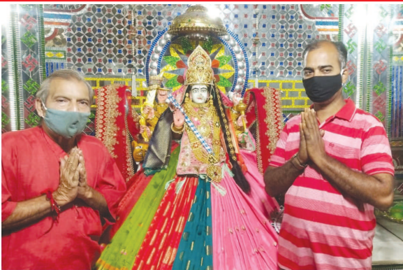
સોલા હાઉસીંગ કોમપ્લેક્સના ચાંદની ચોક-નારણપુરા માં આવેલ અંબાજી માતાજીને એક થી વધારે સૂડી પહેરાવી વિશિષ્ટ શણગાર કરવામાં આવ્યો હતો. શણગારને કારણે દર્શનાર્થીઓ પ્રભાવિત થયા હતા.