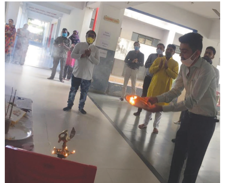
૨૪મી ઓક્ટોબરના રોજ આઠમ (દુગાંઠમી)ના દિવસે ગાંધીનગર ઈન્ટરનેશનલ પબ્લીક સ્કૂલમાં મહાઆરતી કરવામાં આવી હતી. જેમાં ટ્રસ્ટી, આચાર્ય અને ઓફિસ સ્ટાફ સોશિયલ ડિસ્ટન્સ સાથે હાજર હતા.