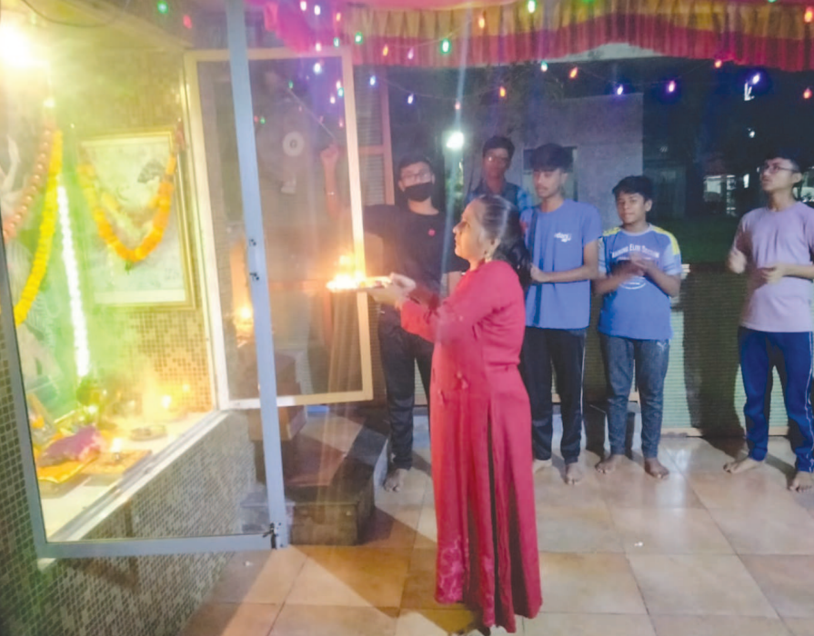
શાલ્વિન સોસાયટી વાવોલ ખાતે સરકારના ગાઈડલાઈન મુજબ ૧ કલાકની સમય મર્યાદાનું પાલન કરીને માતાજીની આરતી-આરાધના કરવામાં આવી હતી. પ્રસાદની વહેંચણી કરવામાં આવતી નથી. આખા વિશ્વમાંથી નાબૂદ થાય તેવી માતાજીને પ્રાર્થના કરીને ડિસ્-સીંગ સાથે નવરાત્રીની સાદગીપૂર્વક ઉજવણી કરવામાં આવી હતી.