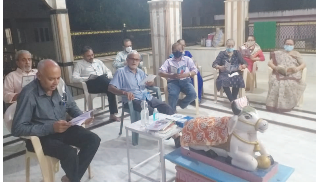
ગાંધીનગરમાં સ્થાયી થયેલા કચ્છી વડનગરા નાગર જ્ઞાતિના રહીશો એ નવરાત્રીમાં શકાદય સ્તુતી, દેવી સુક્ત, દેવી અપરાધ ક્ષમાપન સ્તોત્ર અને મા અંબાની આરતીનાં સમૂહ પઠન દ્વારા કરાતી મા જગદંબાની આરાધનાની છેલ્લાં ૬૦ વર્ષથી ચાલી આવતી પરંપરાને કોરોના ના નિયમોનું ચુસ્તપણે પાલન કરીને પણ જાળવી રાખી અને સેક્ટર-૬બી સ્થિત ચન્દ્રમોલેશ્વર મહાદેવ મંદિર ખાતે નવ દિવસ માટે ભક્તિમય માહોલ ઉભો કરી દીધો છે.