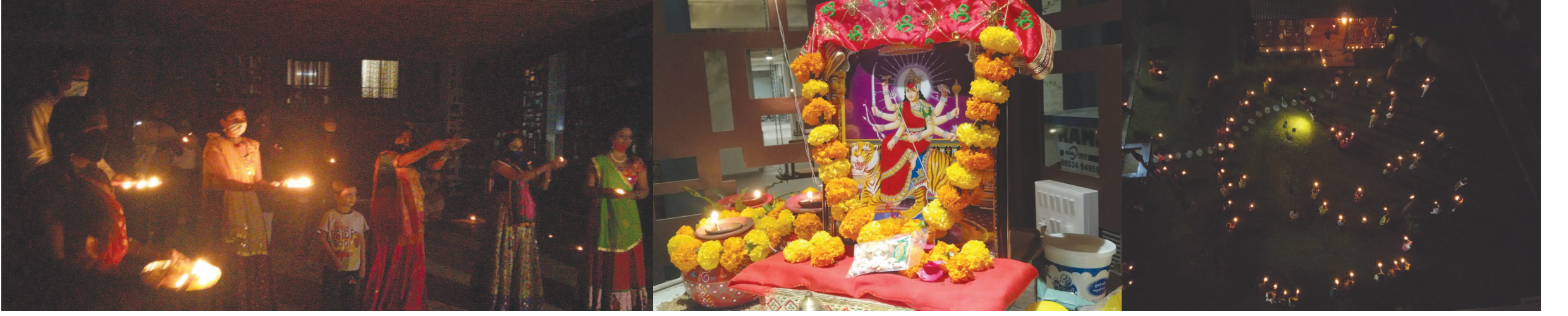
નવરાત્રીના અંતિમ દિવસોમાં હરિઆલય સોસાયટી ખાતે આઠમની મહાઆરતી થઈ હતી. જેમાં સોસાયટીના રહીશોએ સોશિયલ ડિસ્ટન્સ જાળવી ભાગ લઈ માતાજીની આરતી તથા આરાધના કરી સૌ સારાવાના થાય એવી પ્રાર્થના કરી રહ્યા છે.