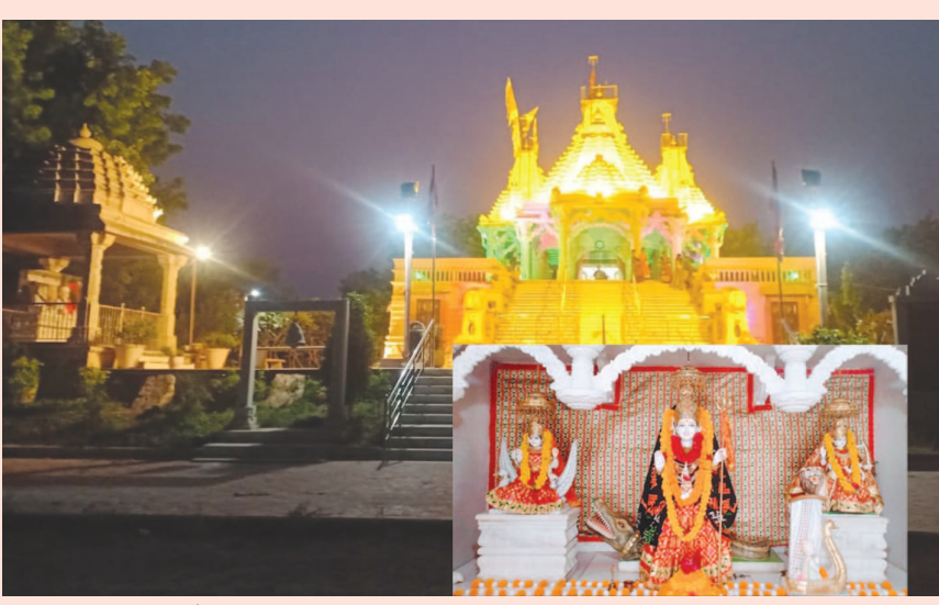
‘મેં તો શણગારો ચાચર ચોક... માડી ઘેર આવોને... મેં તો ગરબો માંડ્યો ગોખ... માડી ઘેર આવો ને...’

નવરાત્રીનું પાવન પર્વ ચાલી રહ્યું છે અને ભલે કોરોના મહામારીના કારણે શેરી ગરબા યોજાઈ શક્યા ના હોય પરંતુ રૂમરૂમ પગલે પધારતા માતાજીના વધામણાં કરવાનું હોયે હેત દરેક શ્રદ્ધાળુઓને એટલું જ ઉમદી રહ્યું છે. ગાંધીનગરના વાવોલ ખાતે પુત્રાસણ રોડ પર આઈ શ્રી ખોડીયાર ધામે દરરોજ રાત્રે કરવામાં આવતી અનોખી રોશની અને માતાજીનો શણગાર ભાવિકોને ભાવવિભોર કરી રહ્યો છે.