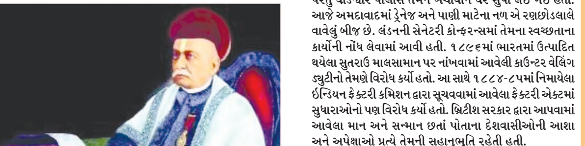
માત્ર મિલ માલિક નહીં, સેવાના ભોખારી પણ બન્યા... યશોધર મહેતાના શબ્દોમાં કહીએ તો, ‘રણછોડલાલ મિલમાં ય જતાં, મ્યુનિસિપાલિટીમાં ય જતાં ને પ્રાર્થના સમાજમાં ય જતાં હતા. મિલનો ઉદ્યોગ ફાલ્યો અને કળ્યો. મ્યુનિસિપાલિટીમાં તેમનું નામ ન ભૂલાય તેમ લખાયું. પ્રાર્થના સમાજમાં તે ભાષાજમાં આપતા પણ ઘેર આવીને પંચાયતન દેવોની પૂજા કરતા હતા. છેવટે તે ધારસભામાં પણ ગયા. ઘરમાં નિત્ય દેવપૂજા-મૂર્તિપૂજા કરતા, પણ એક વખત દેવ અને પૂજાના પાત્રો ચોરાઈ ગયા ત્યાર પછી આવી બાબપૂજા એમણે જીવના છેલા વર્ષોમાં છોડી દીધી હતી. આમ છતાં ભોજન પહેલાં નિત્ય સંધ્યાવંદન અને વૈશ્યદેવનું બ્રાહ્મણોચિત આહીક શરીર ચાલ્યું ત્યાં સુધી કરતા રહ્યા. તેમણે દેશભરમાં અનેક તીર્થસ્થાનોની જાત્રાઓ કરી અને તીર્થસ્થાનોએ યાત્રાળુઓ માટે મોટા ટાક બંધાવ્યા. અમદાવાદની ૧૧૦૦ વર્ષ જૂની આરસી ટેકનિકલ ઈન્સ્ટિટ્યુટનું નામ જેમના પરથી પડ્યું છે તે રાવ બહાદુર રણછોડલાલ છોટાલાલ ૨૬મી ઓક્ટોબર ૧૯૯૮ના રોજ અવસાન પામ્યા હતા.