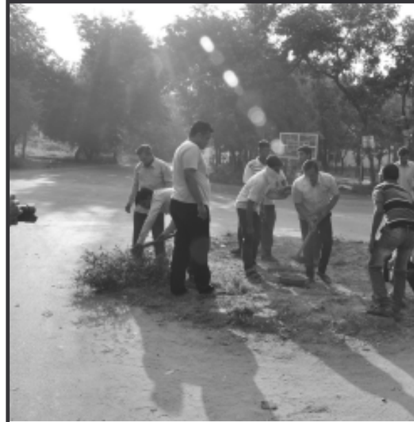
સ્વામિનારાયણ મંદિર સે. ૨૩ દ્વારા પૂ. શાસ્ત્રી હરિકેશવદાસજીની પ્રેરણાથી સ્વચ્છતા અભિયાનમાં મંદિરના પચાસ જેટલા યુવાનો, સંતો, તેમજ કોર્પોરેટ જીબાબાપુએ સાથે મળી જાહેર રસ્તાઓને સાફ કરીને સુંદર પ્રેરણા પુરી પાડી હતી.

ગાંધીનગર, તા. ૩ ગાંધીનગરના સે. ૧૨ માં આવેલ બલરામ મંદિર પરિસરમાં તા. ૩૦મી સપ્ટેમ્બરે ગ્રો ફાઉન્ડેશન અને સાધના સંસ્થા દ્વારા બાળકોના ગરબા-૨૦૧૪ નામનો વિશિષ્ટ કાર્યક્રમ યોજવામાં આવ્યો હતો. આ કાર્યક્રમમાં માનસિક અને શારિરીક રીતે વિશિષ્ટ બાળકો માટે ગરબા યોજવામાં આવ્યા હતા. આ કાર્યક્રમના આયોજનનો મુખ્ય ઉદ્દેશ અને તેમના વિકાસ માટેનો હતો. આ ઉપરાંત આ બાળકોને નવરાત્રી પર્વ નિમિત્તે માતાજીના ગરબાનો આનંદ અપાવવા પણ આ કાર્યક્રમ યોજવામાં આવ્યો હતો. આ કાર્યક્રમમાં માનસિક ક્ષતિગ્રસ્ત, અંધ, બહેરા-મુંગા હોય તેવા ૨૦૦ થી વધુ બાળકોએ અન્ય એટલા જ સમાજના સામાન્ય માનવીઓ સાથે ગરબાનો આનંદ માણ્યો હતો. આ કાર્યક્રમને સફળ બનાવવા ગાંધીનગરની દરેક જેટલી સંસ્થાઓએ જહેમત ઉઠાવી હતી. કાર્યક્રમ પત્યા બાદ આ બાળકોને સમદર્શન આશ્રમ દ્વારા ભોજન કરાવી તૃપ્ત કરાયા હતા.