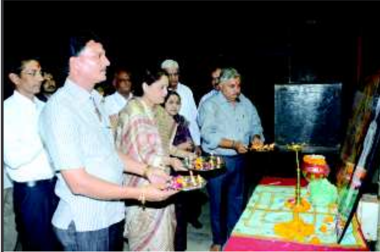
આરતી - શરદ પૂનમની રાત્રે રાસ-ગરબાની રમઝટ પૂર્વે માતાજીની આરતી ઉતારાઈ હતી... જલારામ ધામ ખાતે જિલ્લા પંચાયતના પ્રમુખ હિનાબેન પટેલ અને સંસ્થાના હોદ્દાદારોએ આરતી ઉતારી હતી જ્યારે ઈન્ફોસીટી ક્લબ ખાતે મેયર શ્રી મહેન્દ્રસિંહ રાણા, ઈન્ફોસીટીના મેનેજિંગ ડિરેક્ટર સુવાસ બારોટ અને આગેવાનોએ આરતી ઉતારી હતી.

અને સંસ્કારનું સંવર્ધન કરવા માટે પાયાની ભૂમિકા સાહિત્ય અને શબ્દો ભજવે છે એમ તેમણે ઉમેર્યું હતું. માહિતી પાતા દ્વારા તૈયાર કરાયેલા ગુજરાત દિપોત્સવી-૨૦૧૦ અંકનું આજે મુખ્યમંત્રી આનંદીબેન પટેલે લોકાર્પણ કરતી વેળા વધુમાં જણાવ્યું હતું કે, દિવાળી એટલે પ્રકાશનું પર્વ આપણી ભીતર પડેલા અજ્ઞાનરૂપી અંધકારને ઉલેચી ઉજળા થવા માટેના પર્વ દીપાવલીને આપણે આપણા અને ગુજરાતના વિકાસ પર્વ તરીકે મનાવીએ. તેમણે કહ્યું કે, એવા સ્વચ્છતાના પદાર્થપાઠને પણ આપણે સૌએ સભાનતાપૂર્વક અમલમાં મુકાને એક ઝુંબેશ ઉપાડવી જોઈએ. લોકલાડીલા પ્રધાનમંત્રી નરેન્દ્ર મોદી દ્વારા અમલમાં મુકાયેલા સ્વચ્છતા અભિયાનને સામાજિક ચેતના સ્વરૂપે પરિણામલક્ષી જનઆંદોલન બનાવવા માટે ગુજરાત રાજ્ય કૃતનિશ્ચયી છે, એમ તેમણે વધુમાં ઉમેર્યું હતું. માહિતી પ્રસારણ વિભાગના અગ્રસચિવ જીસી મુમુએ કહ્યું કે, ગુજરાતના પ્રથમ મહિલા મુખ્યમંત્રીની નેતૃત્વ હેઠળ ગુજરાતની