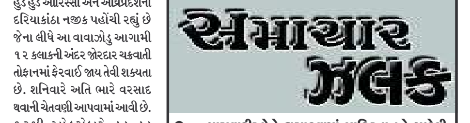
ગોઠવી દેવામાં આવી છે. વાવાઝોડુ હુડ હુડ ઓરિસ્સા અને આંધ્રપ્રદેશના દરિયાકાંઠા નજીક પહોંચી રહ્યું છે જેના લીધે આ વાવાઝોડુ આગામી ૧૨ કલાકની અંદર જોરદાર ચક્રવાતી તોફાનમાં ફેરવાઈ જાય તેવી શક્યતા છે. શનિવારે અતિ ભારે વરસાદ થવાની ચેતવણી આપવામાં આવી છે. ૧૨ મી ઓક્ટોબરે હુડ હુડ

ભુવનેશ્વર, તા. ૧૦ વાવાઝોડુ હુડ હુડ હવે વિશાખાપટ્ટનમથી ૫૩૦ કિલોમીટરના અંતરે સ્થિત છે. આના કારણે ભારે નુકસાન થવાની શક્યતા દેખાઈ રહી છે. ૧૫૫ કિલોમીટર પ્રતિકલાકની ઝડપે પવનની સાથે ભારે વરસાદ પડે તેવી શક્યતા છે. આ વાવાઝોડુ હવે પશ્ચિમ, ઉત્તર પશ્ચિમ તરફ આગળ વધશે. હવે પુર્વીય ગોદાવરી, વિશાખાપટ્ટનમ, વિજયાનગરમ અને શ્રીકાકુલમ જિલ્લામાં ભારે વરસાદ થઈ શકે છે. આવતીકાલથી ભારે વરસાદની શરૂઆત થશે. રવિવાર સવારથી જ ૧૫૫ કિમી પ્રતિકલાકની ઝડપે પવન ફુંકાઈ શકે છે. મુખ્યમંત્રી ચંદ્રબાબુ નાયડુ દ્વારા તૈયારીની સમીક્ષા કરવામાં આવી છે. આંધ્ર અને ઓરિસ્સા દ્વારા અસર થઈ શકે તેવા લોકોને ખસેડી લીધા છે. એનડીઆરએફ અને અન્ય ટીમો