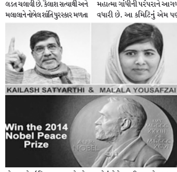
અંક નવો ઈતિહાસ રચાયો છે. કમિટિનું કહેવું છે કે, સત્યાર્થીએ અંક નવો ઈતિહાસ રચાયો છે. કહેવું છે કે, સુકી બાળકો વધુ ધ્યાન આપે તે જરૂરી છે. વિશ્વાસ ગરીબ

અધિકારો માટે સતત સંઘર્ષ કરતા રહ્યા છે. બીજી બાજુ મલાલા યુસુફ જીની પણ પાકિસ્તાનમાં બાળકોના શિક્ષણ સાથે જોડાયેલી છે. તે તાલિબાનના જીવલેણ હુમલામાં સહજમાં બચી