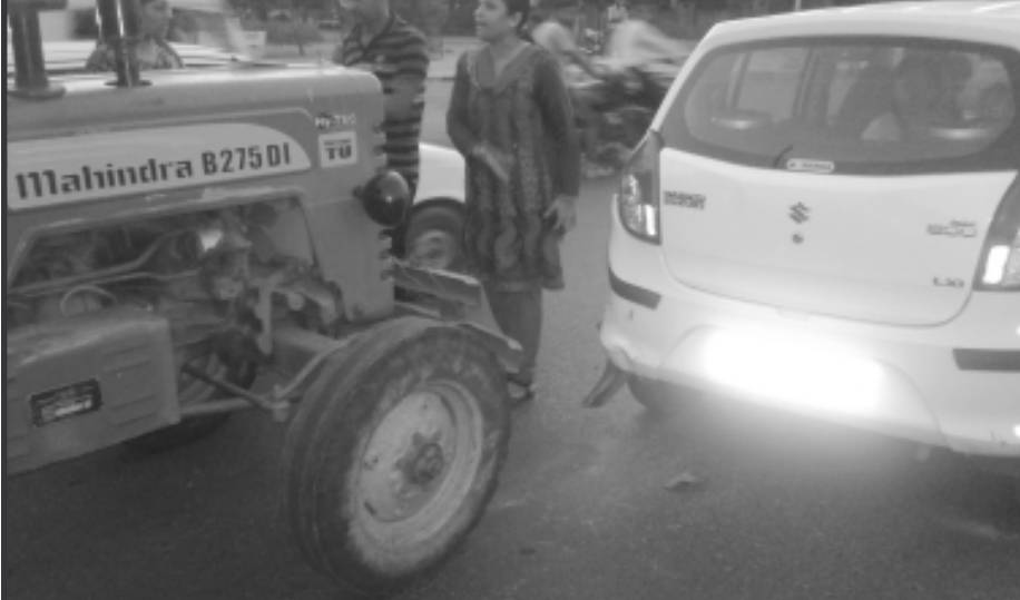
ચ-૬ સર્કલ પાસે સમી સાંજે ટ્રેક્ટર અને અલ્ટો કાર વચ્ચે અકસ્માત થયો હતો. ટ્રેક્ટરના ડ્રાઈવરે બેંકામ ટ્રેક્ટર દોડધામ અલ્ટો કારને ટક્કર મારી હતી. સદનસીબે અંદર બેઠેલા વ્યક્તિઓનો આબાદ બચાવ થયો હતો અને કારને નુકશાન થવા પામ્યું હતું. પરંતુ પહોલા રોડના કારણે બેંકામ બનતા ડ્રાઈવરો સામે લાલ આંખ કરવાની જરૂર છે.