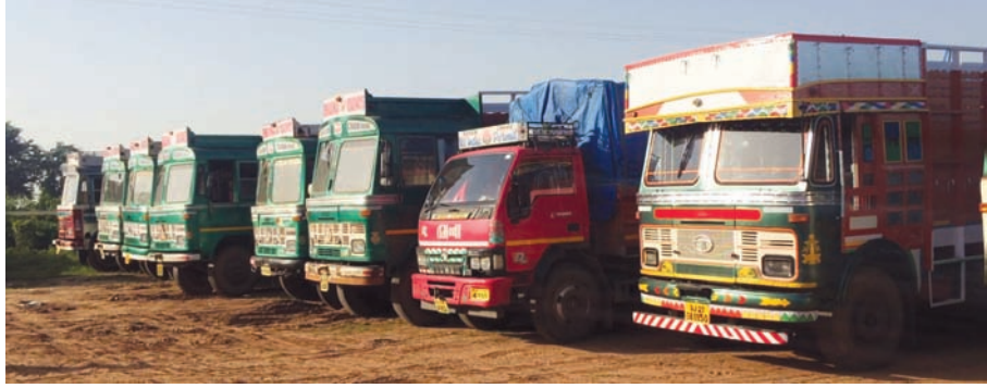
ટ્રાન્સપોર્ટસના સમયનો અને ડીઝલનો અભાજો રૂપિયાનો વ્યય અટકાવવાની અને ટ્રાન્સપોર્ટસના પેમેન્ટ પર બે ટકા કરકાષાત ટેકસ ડીડકશન એટ સોર્સ કરવાની માગણી સાથે દેશભરના ટ્રક ટ્રાન્સપોર્ટસ દ્વારા અપાયેલી અચોક્કસ મુદત પર ઉતરતા ગુરુવારે સવારથી જ અરવલ્લી જિલ્લાના માર્ગો પર અને અનેક સ્થળોએ જિલ્લાના માર્ગો પરથી પસાર થતા ટ્રકોના પૈડા થંભી ગયા હતા. ટ્રક અને ભારે માલવાહક વાહનોની અવર-જવર અટકી જતાં જિલ્લાના માર્ગો જાણે સૂમસામ બની ગયા હોય તેવું લાગતું હતું.