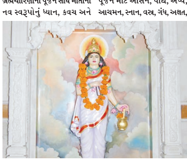
સ્તોત્રનો પાઠ કરવો એ ઈચ્છિત પુષ્ય, સૌભાગ્ય દ્રવ્ય, ધૂપ-દીપ, કામનાની પૂર્તિ કરે છે. માતાજીના નૈવેદ્ય, ઋતુફળ, મુખવાસ, નીરાજન,

ગાંધીનગર, તા. ૨ જગત જનની જગદંબાના પર્વમાં ચાલુ વર્ષે બે એકમ હોવાથી આમ તો આજે નવરાત્રીનો ત્રીજો દિવસ છે. પરંતુ એકમ દરમિયાન મા દુર્ગાના પ્રથમ સ્વરૂપનું પૂજન થયું હોઈ બે દિવસ શૈલપૂત્રીના સ્વરૂપનું વિધિ વિધાન પૂર્વક પૂજન કરી નવરાત્રીની આરાધનાનો મંગલ પ્રારંભ થયો છે. આજે આદ્ય શક્તિના બીજા સ્વરૂપ મા બ્રહ્મચારિણીના પૂજનનો મહિમા વર્ણવાયો છે. આકરા તપથી મહાદેવને પ્રસન્ન કરનાર આ દેવીના પૂજનથી તપ, ત્યાગ, સદાચાર અને સંયમ જેવા સદ્ગુણોની પ્રાપ્તિ થતી હોય છે. શક્તિની આરાધનાના પર્વ