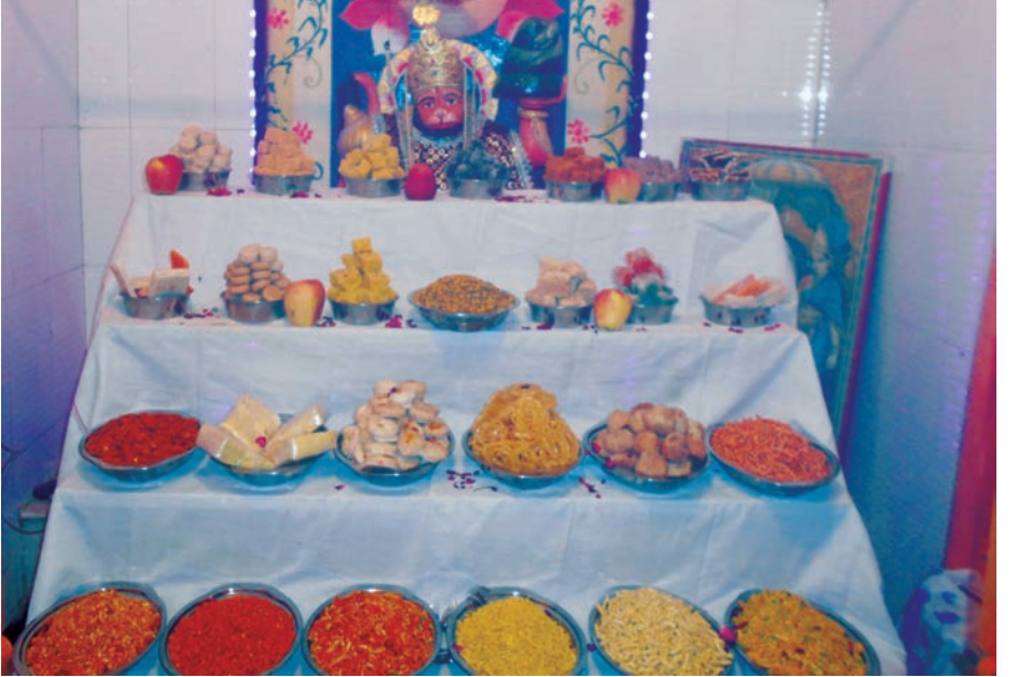
સેક્ટર-૬ બી ખાતે સ્થિત શ્રી ચંદ્રમોલેશ્વર મહાદેવ મંદિર પરિસરમાં સ્થપાયેલા શ્રી હનુમાનજી મંદિર ખાતે કાળી ચૌદશ નિમિત્તે ભવ્ય અન્નકૂટનું આયોજન કરવામાં આવ્યું હતું, જેના દર્શન માટે મોટી સંખ્યામાં ભક્તો ઉપસ્થિત રહ્યા હતા અને અન્નકૂટનાં દર્શન કરી સૌએ ધન્યતા અનુભવી હતી.

શુભેચ્છાનું આદાન-પ્રદાન કરશે. મુખ્યમંત્રીશ્રી સવારે ૮.૫૦ કલાકે રાજ્યપાલશ્રીને રાજભવન ખાતે નવા વર્ષની શુભેચ્છાઓ પાઠવશે. આ વર્ષે નૂતનવર્ષ પ્રારંભ દિવસ અને લોહપુરૂષ સરદાર વલ્લભભાઈ પટેલની ૧૪૧મી જન્મજયંતિનો સુભગ સુયોગ રચાયો છે ત્યારે મુખ્યમંત્રીશ્રી ગાંધીનગરમાં સ્વર્ણિમ પાર્કમાં સરદાર સાહેબની પ્રતિમા સમક્ષ સવારે ૮.૧૫ કલાકે આદરોજલી અર્પણ કરવાના છે અને રાષ્ટ્રીય એકતા દિવસના શપથમાં જોડાશે. મુખ્યમંત્રીશ્રી સરદાર