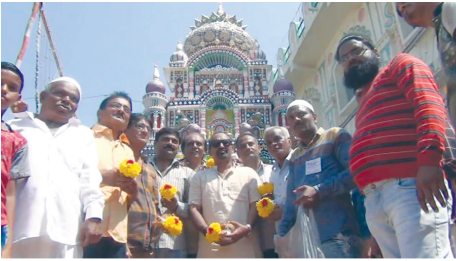
લગાઈમાં શાહિદ થયા હતા જેને સુધી માતમ મનાવવાની સાથે રોજ દિવસે રોઝા રાખી ઈબાદત

અરવલ્લી જિલ્લાના મુખ્યમથક મોડાસા રવિવારે તાજુયાનું મોડાસા નગરમાં કર્બા સમાજના લોકો દ્વારા જુલુસ નીકળી શહેરના માર્ગો પર ફેરવવામાં આવ્યું હતું. તાજુયા જુલુસમાં માનવમહેરામણ ઉમટ્યું હતું. મોડાસા રથયાત્રા સમિતિ દ્વારા ધોરીઓના ચોકમાં ઉખાભેર સ્વાગત કરવામાં આવતા કોમી એખલાસના દ્રશ્યો સર્જાયા હતા. મોહરમના દસ દિવસ એટલેકે આશાઝના દિવસ હજરત મોહમ્મદ પયગંબર સાહેબના નવાસા હજરત હુસેન સાહેબ