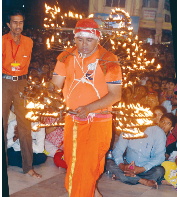
અંબાજીમાં મા અંબાના ચાચરચોકમાં ૫૦૧ દીવડાની આરતી

જતા સગાસંબંધીઓ સહિત લોકોના ટોળેટોળા ઘટનાસ્થળે દોડી આવ્યા હતા. પ્રાંતિજના ઈન્દિરાનગર પાસે આવેલ પાણીના સંપ પાસેથી ઝાડ પર ગળેફાંસો ખાધેલો મૃતદેહ મળી આવ્યો હતો. જ્યારે સમાચાર વાયુવેગે પ્રસરી