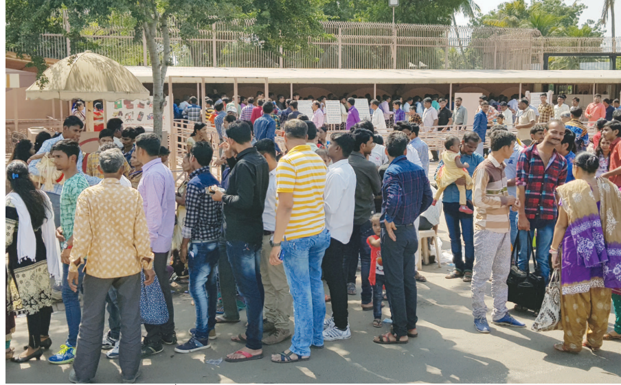
અક્ષરધામમાં સનાતન શો : દિવાળી પર્વો નિમિત્તે અતિઆધુનિક ટેકનોલોજીથી તૈયાર કરાયેલ અક્ષરધામની ગાથા અને સંદેશ આપતો શો માણવા ભાવિકોની ભીડ ઉમટે છે. જીવનના મૂલ્યો અને પ્રમુખ સ્વામીના સંદેશ અદ્ભુત રીતે પ્રસ્તુત કરાતો અનોખો શો અક્ષરધામનું અદ્ભુત આકર્ષણ બન્યો છે.