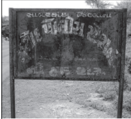
તલોદ-મજરા રોડ ઉપર આવેલ પારી નદીના પુલના તલોદ તરફના છેડે લગાવેલ તલોદ પોલીસ સ્ટેશનની હદ દર્શાવતા બોર્ડની આ તસવીર છે. જે બોર્ડ કાટ પાઈ જતાં એક તરફ લગભગ 'અવાચ્ય' બન્યું છે. તલોદ પોલીસ સ્ટેશનના ત્રણ ત્રણ પોલીસ સબ ઈન્સ્પેક્ટરોની અનુક્રમે બદલીઓ થવા પામી છે. પરંતુ માત્ર ૩ કુટુંબના આ બોર્ડની મરામત શક્ય બની નથી!! જે બોર્ડની પૂર્વ દિશાએ તલોદ પોલીસની હદ શરૂ થાય છે. જ્યારે પશ્ચિમ દિશાએ પ્રાંતિજ પોલીસની હદ શરૂ થાય છે. આમ બે પોલીસ સ્ટેશનની હદની સમજ આપતું આ બોર્ડ 'બેહદ' ખરાબ ભાસી રહ્યું છે. જેની યોગ્ય કાળજી લઈ મરામત કરવાની તાતી જરૂરત જણાઈ રહી છે.

આ બનાવ અંગે વસાઈ પોલીસે કાયદેસરની કાર્યવાહી હાથ ધરી છે. હત્યાના આ બનાવમાં સંડોવાયેલ શખ્સોની હજી ધરપકડ થઈ નથી તેવું જાણવા મળેલ છે.