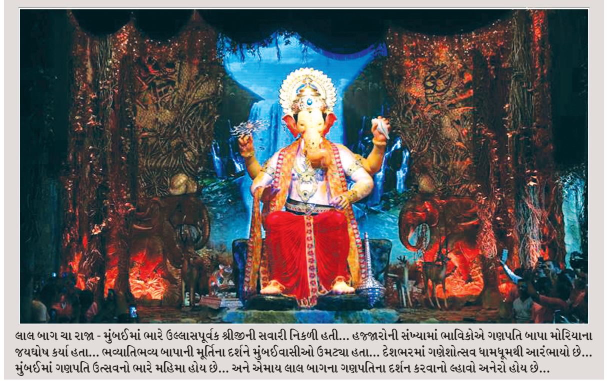
લાલ બાગ ચા રાજા - મુંબઈમાં ભારે ઉલ્લાસપૂર્વક શ્રીજીની સવારી નિકળી હતી... હજારોની સંખ્યામાં ભાવિકોએ ગણપતિ બાપા મોરિયાના જયઘોષ કર્યા હતા... ભવ્યાતિભવ્ય બાપાની મૂર્તિના દર્શને મુંબઈવાસીઓ ઉમટવા હતા... દેશભરમાં ગણેશોત્સવ ધામધૂમથી આરંભાયો છે... મુંબઈમાં ગણપતિ ઉત્સવનો ભારે મહિમા હોય છે... અને એમાંય લાલ બાગના ગણપતિના દર્શન કરવાનો લ્હાવો અનેરો હોય છે...

દવાના વેચાણ અને સંગ્રહ ઉપર તરત જ પ્રતિબંધ : આરોગ્ય માટે દવાઓ ખુબ ખતરનાક હોવાથી ૩૫૦થી વધુ દવાઓ પર પ્રતિબંધ : મોટાભાગની પેઇનકિલરો છે નવી દિલ્હી, તા. ૧૩ માથાના દુખાવા અને અન્ય શરીરના દુખાવા માટે આરોગ્ય લેવામાં આવતી કેટલીક દવા સહિત કુલ ૩૫૦ દવા પર તાત્કાલિક ધોરણે પ્રતિબંધ મુકી દેવાનો નિર્ણય કરવામાં આવ્યો છે. વડાપ્રધાન નરેન્દ્ર મોદીના નેતૃત્વમાં એનડીએ સરકારે ફિક્સ ડોઝ કોમ્બિનેશન (એફડીસી)ની દવા પર પ્રતિબંધ મુકવાનો નિર્ણય કર્યો છે. જે દવા પર પ્રતિબંધ મુકવામાં આવ્યો છે તેમાં કેટલીક એવી દવા છે જે સામાન્ય લોકો કોઈ પણ દુખાવો થવાની સ્થિતિમાં તરત જ ખરીદી લેતા હતા. જે દવા પર પ્રતિબંધ મુકાયો છે તેમાં સેરિડોન ઉપરાંત પેન્ડર્મ પ્લસ, ટેકિસગ એડેડ, ડીકોલ ટોલેનો સમાવેશ થાય છે. સામાન્ય ઉપયોગમાં આરોગ્ય દવા લેવામાં આવી રહી હતી. ફટકાટ આરામ મેળવી લેવાના ઈરાદામાં આ પ્રકારની દવા સૌથી વધારે વેચાઈ રહી હતી. હવે તેના પર પ્રતિબંધ મુકી દેવામાં આવ્યા બાદ આ પ્રકારના દવાના બનાવટ અને વેચાણ પર રક રહેશે. નિયમોની સાથે ચેડા કરનારને દંડ કરવામાં આવશે. જે દવા પર પ્રતિબંધ મુકી દેવામાં આવ્યો છે તેમાં સેરિડોન, વિક્સ એક્શન ૫૦૦ અને અન્ય દવાનો સમાવેશ થાય છે. છેલ્લા કેટલાક સમયથી આ પ્રકારની દવાના ઉપયોગ પર પ્રતિબંધ મુકવા માટેની માંગ ઉઠી રહી હતી. આખરે આ દવાના ઉપયોગ પર પ્રતિબંધ મુકી દેવામાં આવ્યો છે. આમી દિવસોમાં અન્ય ફિક્સ ડોઝની કોમ્બિનેશન વાળી દવા પર પણ તવાઈ આવી શકે છે.