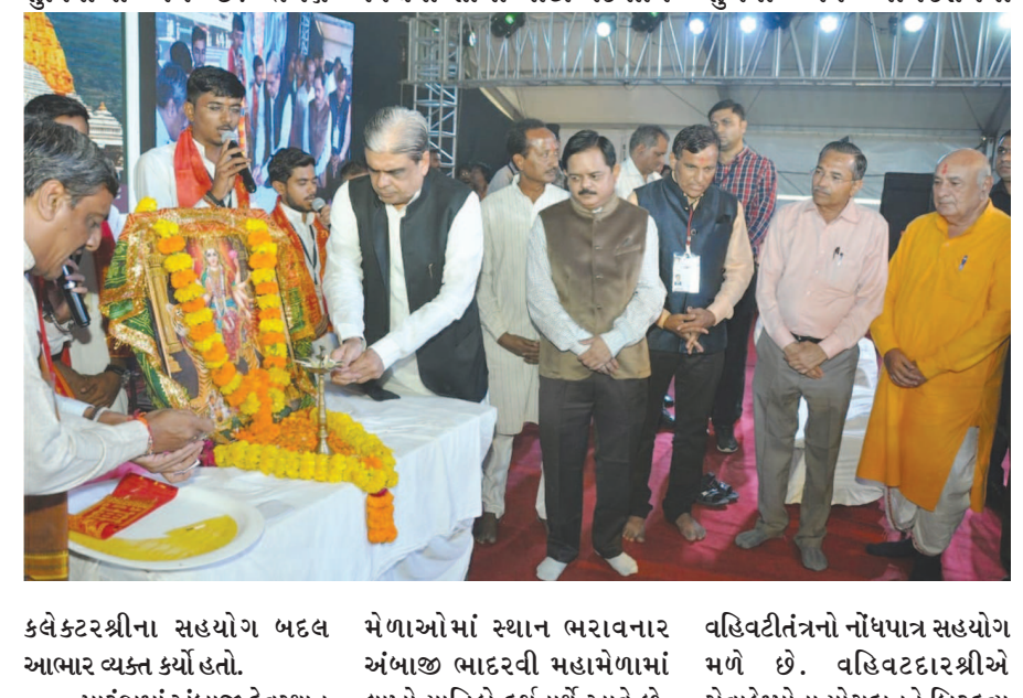
પુનમનો મહામેળો સુખરૂપ સમપ્ત જણાવ્યા પ્રમાણે ૨૬ લાખથી વધુ માઈભક્તોએ ભોજનપ્રસાદનો લાભ