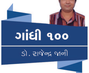
ગાંધી ૧૦૦ ડૉ. રાજેન્દ્ર જીવની

કરીને ચપટી મીઠું ઉપાડીને અમાનુષી કાયદા સામે વિરોધ વ્યક્ત કરતા કવિ 'બ્રિટીશ સલ્તનતના પાયામાં લૂણ લગાડું છું.' - આ એક જ વાક્ય પણ ગાંધી કેટલું ભારીકાઈથી શબ્દોમાં રજૂ