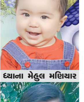
ધ્યાના મેહુલ મહિયાર