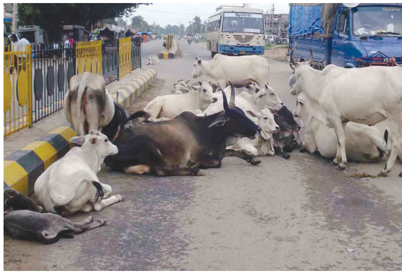
લોકમાંગણી છે. ભિલોડા તાલુકા મથકે જાહેર માર્ગો ઉપર, શોપીંગ સેન્ટરો

ભિલોડામાં માર્ગો ઉપર રખડતા પશુઓથી પ્રજાજનો અને વાહનચાલકો હેરાન-પરેશાન થઈ રહ્યા છે. માર્ગો પશુઓની ગમાણોમાં ફેરવાયા છે. ભિલોડામાં ઈડર-શામળાજી ધોરીમાર્ગ ઉપર રખડતા પશુઓથી પ્રજાજનો, રાહદારીઓ, વાહનચાલકો ત્રાહિમામ પોકારી ગયા છે. જ્યારે ખાસ કરીને બજાર વિસ્તારોના માર્ગો ઉપર રખડતી ગાયો, બકરાં, ગધેડાં, કુતરાઓના અડિંગા રહેતા હોવાથી ટ્રાફિકમાં ભારે અવરોધ સર્જાય રહ્યો છે. જ્યારે કેટલાક વાહન ચાલકોને ગાયો અને સાંઢ શીંગડે ચડાવતા હોવાથી અકસ્માતો વધ્યા હોવાનું લોકમુખે ચર્ચાય છે. ગાયને માતા કહેનારા હિંદુઓ ગાય માતાને રખડતી મુકી દેતાં જીવદયા પ્રેમીઓમાં ભારે રોષ જોવા મળી રહ્યો છે. જીવદયા પ્રેમીઓના જણાવ્યા મુજબ ગાય સહિત અનેક પશુઓને રેડાં મુકનારા પશુપાલકો સામે લાગતા-વળગતા તંત્રના જવાબદાર અધિકારીઓ ધ્વારા સત્વરે