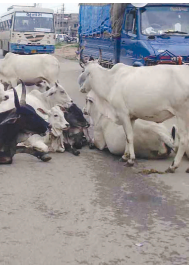
પાસે દેર-દેર ગાયોના ટોળે-ટોળા અડિંગો જમાવી બેસતા હોવાથી રાહદારીઓ, વાહન