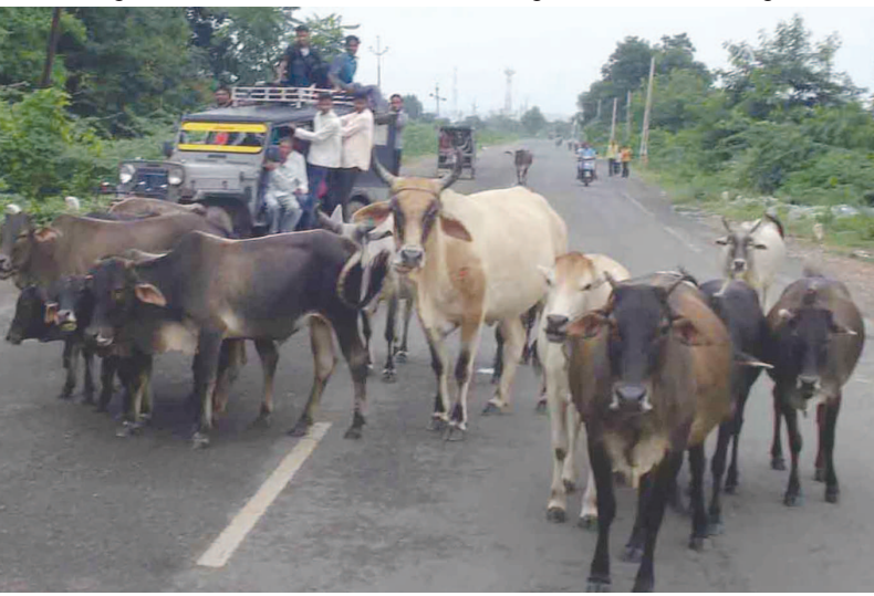
મળી રહ્યો છે. રખડતા પશુઓના કારણે સ્વચ્છ રહેતા સોસાયટી વિસ્તારોમાં પણ