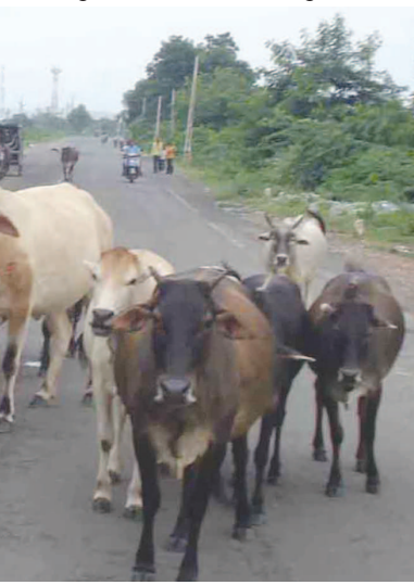
ભિલોડાના આસપાસના સીમવિસ્તારમાં રખડતી ગાયોના ટોળે-ટોળા સીમવિસ્તારમાં

કેટલાય ખેતરોમાં રાત્રીના સુમારે ઉભા પાકનું ભેરાણ કરી દેતા હોય છે જેના કારણે ખેડૂતોની ઉંધ હરામ થઈ ગઈ છે. છેલ્લા કેટલાક સમયથી રખડતા પશુઓનો ત્રાસ અસહ્ય વધી રહ્યો છે. રખડતી ગાયોના ટોળે-ટોળા જાહેર માર્ગોની વચ્ચે અડિંગો જમાવતા હોવાથી વાહન ચાલકો, રાહદારીઓ ભારે મુશ્કેલીમાં મુકાઈ રહ્યા છે. છેલ્લા કેટલાક સમયથી માર્ગો ઉપર રખડતા પશુઓનો ત્રાસ જોવા મળે છે. શહેરી વિસ્તારોમાં વાહનોની ગીચતા વચ્ચે ગાયોના ટોળે-ટોળા ટ્રાફિકને અવરોધતા હોવાથી રાહદારીઓ, વાહનચાલકોની હાલાકીમાં વધારો થયો છે. ગ્રામજનોના જણાવ્યા મુજબ લાગતા-વળગતા તંત્રના જવાબદાર અધિકારીઓ ધ્વારા રખડતા પશુઓને રેડાં મુકનારા માલિકો સામે સત્વરે કડક કાર્યવાહી કરવી જોઈએ તેવો સુર વાહનચાલકો તેમજ રાહદારીઓમાંથી ઉઠવા પામ્યા છે. જાહેર માર્ગો ઉપર અડિંગો જમાવી બેઠેલી ગાયો તસ્વીરમાં ટ્રપ્પીગોચર થાય છે.