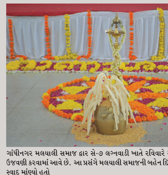
ગાંધીનગર મલયાલી સમાજ દ્વાર સે-૭ લગ્નવાડી ખાતે રવિવારે ઓણમના પર્વની ઉજવણી કરવામાં આવી હતી. ઓણમ પર્વ મહાબલી રાજની યાદમાં મલયાલી સમાજ દ્વારા ઉજવણી કરવામાં આવે છે. આ પ્રસંગે મલયાલી સમાજની બહેન ટિકરીઓએ કુલવોની રંગોળી સહીત અનેકવિધ સાંસ્કૃતિક કાર્યક્રમો રજૂ કર્યા હતા. જ્યારે કેળવણી પાન પર ભોજનનો સ્વાદ માંણ્યો હતો

ગાંધીનગર મહાનગરપાલિકા દ્વારા રહેણાંક વિસ્તારોમાં ચાલતી ગેરકાયદે હોસ્ટેલ સામેની ઝુંબેશ સોમવારથી આગળ વધશે. મનપાના તંત્ર સામે સંકલન સમિતિની બેઠકમાં બોલેલી ટડાપીટ પછી હવે હરકતમાં આવેલા તંત્રએ સે. ૧, ૨ અને ૮માં આવી હોસ્ટેલના સંચાલકોને નોટીસ ફટકારી છે. મહાનગરપાલિકા દ્વારા સે. ૨૫માં એકતરફી કાર્યવાહી કરવામાં આવી રહી હોવાની ઉટેલી છાપને લુંછવા માટે સે. ૧, ૨ અને ૮માં રહેણાંક વિસ્તારમાં ચાલતી ૧૩ થી વધુ હોસ્ટેલોને ગઈકાલે જ નોટીસ આપી દીધી છે. મનપાના તંત્ર દ્વારા આ સેક્ટરોમાં નોટીસ અપાઈ છે તેમાં કેટલાક ઉચ્ચ અધિકારીઓ અને રાજકીય પક્ષના આગેવાનોનો પણ સમાવેશ થાય છે. મનપાના તંત્ર દ્વારા નોટીસો આપવાની કાર્યવાહી થયા બાદ હવે આનું સીલીંગ કરવામાં આવે છે કે કેમ? તેના પર સૌની નજર મંડાયેલી છે. ● અનુસંદાન પાન-૭ પર