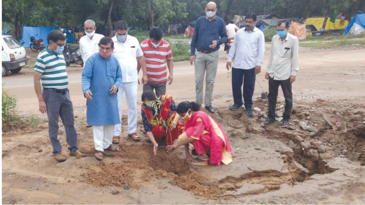
રચનાત્મક વિરોધ : શહેરમાં ગાબડા, ભૂવા, ખાડા જ્યાં જ્યાં પડ્યા હોય ત્યાં વૃક્ષારોપણ કરી રચનાત્મક વિરોધ પ્રદર્શિત કોંગ્રેસ દ્વારા કરાયો હતો.

આખા ગુજરાત માટે અને ખાસ કરીને ખેડૂતો માટે રાહતના સમાચાર છે. બંગાળની ખાડીમાં જે લો પ્રેશર સર્જાયો બાદ સિસ્ટમ બની હતી તે પાકિસ્તાન તરફ ફંટાઈ ગઈ છે. જેના પગલે હવે આગામી પાંચ દિવસ સુધી ભારે વરસાદની શક્યતા નથી. જોકે, ગુજરાતમાં યોમાસાના વિદાયને હજુ પણ એક મહિનો બાકી છે એટલે આ દિવસોમાં જો નવી સિસ્ટમ બનશે તો ફરીથી વરસાદ પડશે. હવામાન વિભાગના કર્ણા પ્રમાણે હાલ પાંચ દિવસ રાજ્યમાં ભારે વરસાદની કોઈ શક્યતા નથી. ભારે વરસાદને પગલે રાજ્યમાં અનેક વિસ્તારોમાં ખેડૂતોનો ઊભો પાક ધોવાયો છે. એટલું જ નહીં ખેતરોમાં સતત પાણી ભરાયેલા હોવાથી પાકને ખૂબ નુકસાન થયું છે. પહેલી સપ્ટેમ્બર, ૨૦૨૦ સુધી રાજ્યમાં સરેરાશ ૧૨૧ ટકા વરસાદ નોંધાયો છે. જોન પ્રમાણે વાત કરવામાં આવે તો સૌથી વધારે સરેરાશ વરસાદ કચ્છમાં પડ્યો છે. કચ્છમાં આ વર્ષે સરેરાશ ૨૫૫ ટકા વરસાદ નોંધાયો છે. ઉત્તર ગુજરાતમાં આ વખતે ૧૦૪ ટકા સરેરાશ વરસાદ પડ્યો છે. પૂર્વ મધ્ય ગુજરાતની વાત કરવામાં આવે તો અહીં સૌથી ઓછો ૮૮.૫૦ ટકા વરસાદ પડ્યો છે. સૌરાષ્ટ્રની વાત કરવામાં આવે તો આ વર્ષે સૌરાષ્ટ્રમાં ૧૬૩ ટકા વરસાદ પડ્યો છે. દક્ષિણ ગુજરાતમાં આ વર્ષે સરેરાશ ૧૦૩ ટકા વરસાદ પડ્યો છે. હવામાન નિષ્ણાત અંબાલાલ પટેલની પણ આગાહી કરી હતી કે રાજ્યમાં ૨૬ થી ૨૮ ઓગસ્ટ સુધી વરસાદનું જોર ઘટશે. આ ઉપરાંત ૩૦ ઓગસ્ટથી વધુ એક વરસાદી સિસ્ટમ સક્રિય થશે. જેના કારણે ૩૦ ઓગસ્ટથી ૩ સપ્ટેમ્બર સુધી ઉત્તર અને મધ્ય ગુજરાત સહિત રાજ્યના કેટલાક ભાગમાં ભારે વરસાદ થશે. ચોથી સપ્ટેમ્બરના દરિયાકિનારે ભારે પવન ફૂંકાશે. જે બાદમાં ૭ થી ૧૨ સપ્ટેમ્બર સુધી ફરી વરસાદ પડશે.