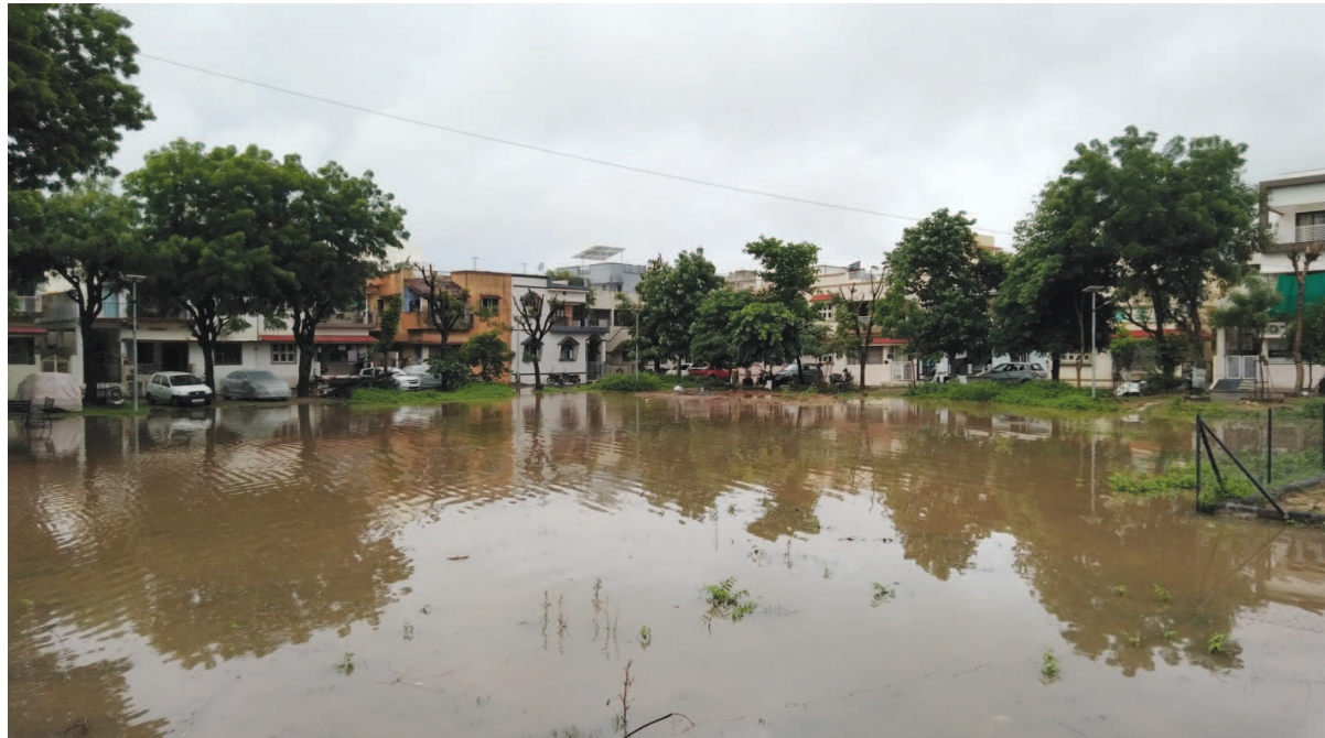
શક્યતા વધવા પામી છે. એક તરફ કોવિડ-૧૯ મહામારી હજુ પણ નમતું જોખી નથી રહી અને નાગરિકો લગભગ છ માસથી આ વાયરસથી પરેશાની ભોગવી રહ્યા છે. બીજી તરફ શરદ ઋતુના પ્રારંભે જ વરસાદી રમઝટના કારણે શહેરમાં સર્જાયેલી ઠેર ઠેર પાણીના ભરાવાની સમસ્યા તથા સતત વાતાવરણમાં આવતા

ગાંધીનગર, તા.૪ શહેરમાં સતત મેઘવર્ષા પછી મેઘરાજાએ ખમૈયા તો ક્યાં છે અને શહેરમાં સારો એવો ઉધાડ પણ નીકળ્યો છે. મચ્છરનો ઉપદ્રવ વધવા પામ્યો છે. મચ્છરનો ઉપદ્રવ વધવાને કારણે ડેન્ગ્યુ મેલેરિયા સહિતની બિમારીઓનું જોર વધે તેવી સ્થિતિ સર્જાઈ છે