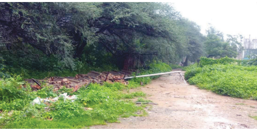
ધોળાકુવાને અડીને આવેલી ઈન્દ્રોડા પાર્કની દિવાલ વધુ વરસાદના કારણે તુટી ગઈ છે. દિવાલ તુટના નજીકમાં આવેલો ઈલેક્ટ્રીક થાંભલો પણ તુટી ગયો છે. જેના કારણે અહીં અંધારપટ સર્જાયો છે. તાત્કાલિક ઈલેક્ટ્રીક થાંભલો રીપેર કરવા પ્રામજનોએ માંગ કરી છે.

ક્યારેક તડકો તો ક્યારેક ઠંડક જેવી સ્થિતિના કારણે નાગરિકોની રોગપ્રતિકારક શક્તિ પર વિપરિત અસર પડી રહી છે અને નાગરિકો ઋતુજન્ય બિમારીઓ જેવી કે શરદી-સળેખમ, તાવ-ઉધરસ, માથાનો દુઃખાવો, શરીર તુટવું, અનેક પ્રકારના જીવજંતુઓનો ઉપદ્રવ વધ્યો છે તેથી પણ ઋતુજન્ય બિમારીઓનું જોર વધી રહ્યું છે. તેને નાથવા સત્વરે જંતુનાશક દવાના છંટકાવની કામગીરી આરંભાય તેવી નાગરિકોમાં માંગ પ્રવર્તી રહી છે.