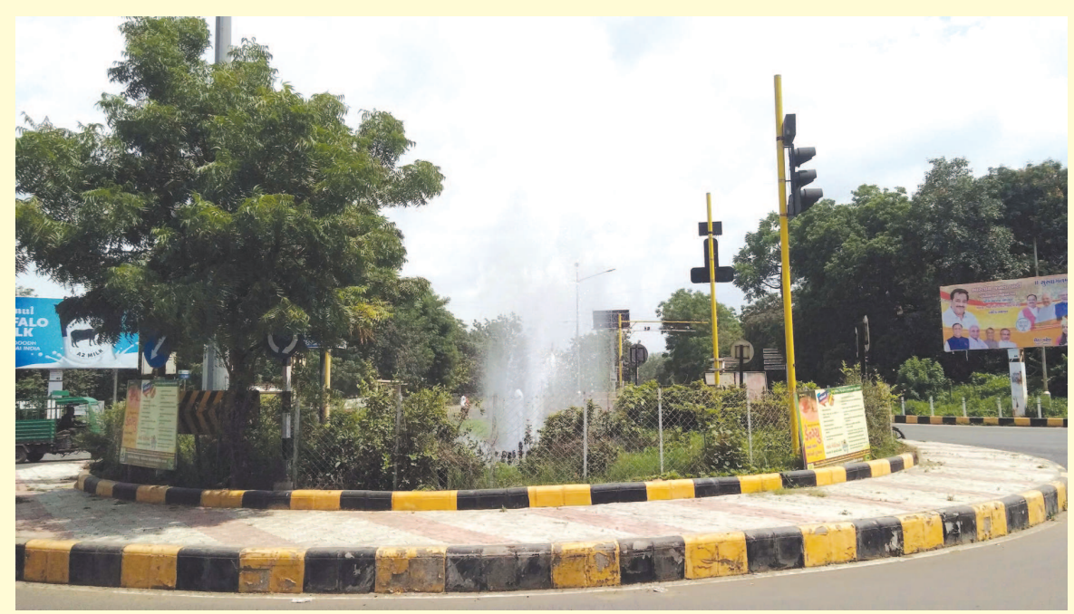
ચ-પનો કુવારો એ એક સમયે ગાંધીનગરની ઓળખ ગણાતો હતો. આ વિસ્તાર રાત્રીના સમયે ધમધમતો રહેતો હતો. શહેરમાં નવા હરવા ફરવાના સ્થળો બનતા ચ-પના કુવારોની રોનકમાં ઘટાડો આવ્યો છે. વળી છેલ્લા કેટલાય સમયથી આ કુવારો બંધ હાલતમાં હતો. આખરે હમણાં જ આ કુવારોને પુનઃ શરૂ કરવામાં આવતા વસાહતીઓ ખુશખુશાલ બની ગયા હતા.