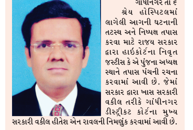
ગાંધીનગર તા. ૬ શ્રેય હોસ્પિટલમાં લાગેલી આગની ઘટનાની તટસ્થ અને નિષ્પક્ષ તપાસ કરવા માટે રાજ્ય સરકાર દ્વારા હાઈકોર્ટના નિવૃત્ત જસ્ટીસ કે.એ. પુજારના અધ્યક્ષ સ્થાને તપાસ પંચની રચના કરવામાં આવી છે. જેમાં સરકાર દ્વારા ખાસ સરકારી વકીલ તરીકે ગાંધીનગર ડીસ્ટ્રીક્ટ કોર્ટના મુખ્ય સરકારી વકીલ હીતેશ એન રાવલની નિમણૂક કરવામાં આવી છે.