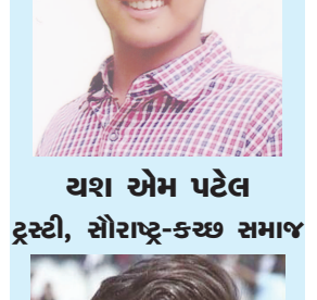
ચશ એમ પટેલ ડ્રસ્ટી, સૌરાષ્ટ્ર-કચ્છ સમાજ