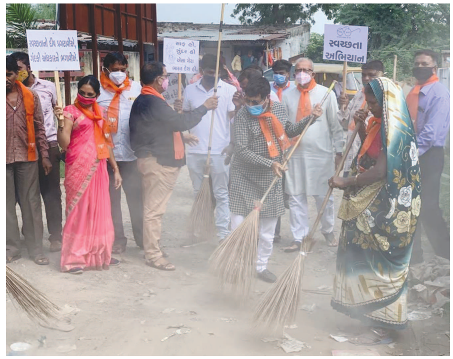
ચિલોડા ખાતે પી.એમ.ના જન્મદિવસ ઉજવણી અંતર્ગત સ્વચ્છતા અભિયાન