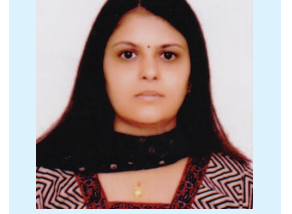
નીતા રાણા લાયોનેસ ક્લબ