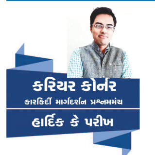
કરિયર કોર્નર કારકિર્દી માર્ગદર્શન પ્રશ્નમંચ હાર્દિક કે પરીખ

વિદ્યાર્થીઓ અલગ-અલગ શૈક્ષણિક બેકગ્રાઉન્ડમાંથી આવે છે, પરંતુ તે સામાન્ય રીતે બેચલર ડિગ્રી ધારક હોય છે. ઘણા પ્લાનસ કોઈક નાના કામથી શરૂ કરતા હોય છે. જેમ કે કેટરિંગ કોઓર્ડિનેટર પોઝિશન, પાર્ટી આયોજક વગેરે. યોગ્ય શિક્ષણ અને અનુભવ સાથે, આયોજનકારો મોટા કાર્યક્રમો, જેમ કે સંમેલનો અને કોર્પોરેટ મીટિંગ્સનું આયોજન કરી શકે છે. પ્રમાણિત ઈવેન્ટ પ્લાનર બનવા માટે, તમારે હોસ્પિટાલિટી મેનેજમેન્ટ, માર્કેટિંગ, જાહેર સંબંધો, સંચાર અથવા વ્યવસાયમાં સ્નાતકની ડિગ્રી પ્રાપ્ત