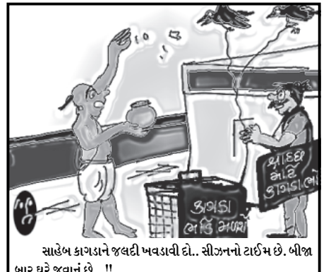
સાહેબ કાગડાને જલદી ખવડાવી દો... સીઝનનો ટાઈમ છે. બીજા બાર ધરે જવાનું છે...!!

શહેરની વિવિધ શૈક્ષણિક સંસ્થાઓ જેવી કે બી.પી. પટેલ કોલેજ ઓફ બીજનેશ એન્ડ મીનીસ્ટ્રીશન, જે.એમ.ચૌધરી ગર્લ્સ હાઈસ્કૂલ તેમજ સેલ્ફ ફાઈનાન્સ હાઈસ્કૂલ અને