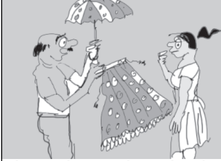
બહેન, આ વખતે સ્કીમ રાખી છે. ચણિયાઓની સાથે - એક છત્રી ફી...!!!