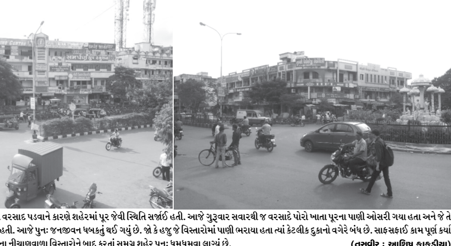
સુરતમાં સતત ત્રણ દિવસથી વરસાદ પડવાને કારણે શહેરમાં પૂર જેવી સ્થિતિ સર્જઈ હતી. આજે ગુરુવાર સવારથી જ વરસાદે પોરો ખાતા પૂરના પાણી ઓસરી ગયા હતા અને જે તે સ્થળોએ સાફ સફાઈ શરૂ થઈ ગઈ હતી. આજે પુનઃ જનજીવન ધમધમ શરૂ થઈ ગયું છે. જો કે હજુ જે વિસ્તારોમાં પાણી ભરાયા હતા ત્યાં કેટલીક દુકાનો વગેરે બંધ છે. સાફ સફાઈ કામ પૂર્ણ કર્યા પછી જ શરૂ થઈ શકે એમ છે. સુરતના નીચાણવાળા વિસ્તારોને બાદ કરતાં સમગ્ર શહેર પુનઃ ધમધમવા લાગ્યું છે.