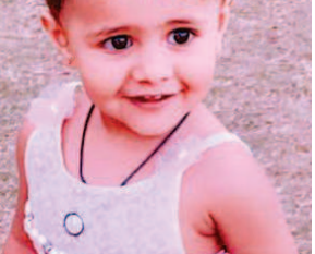
કિષા રિશિત ખેષી